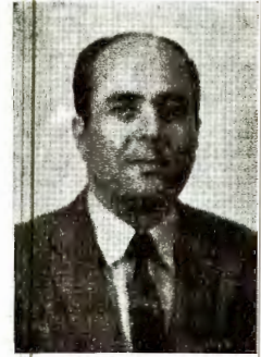
الدكتور رشيد الدجاني