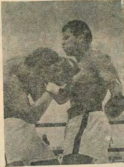
محمد علي كلاي ينتصر على جو فريزر

— لا ادري ، ربما شقيقي عام ٧٦ يعلم ذلك ، ثم لا تنسى الهدوء