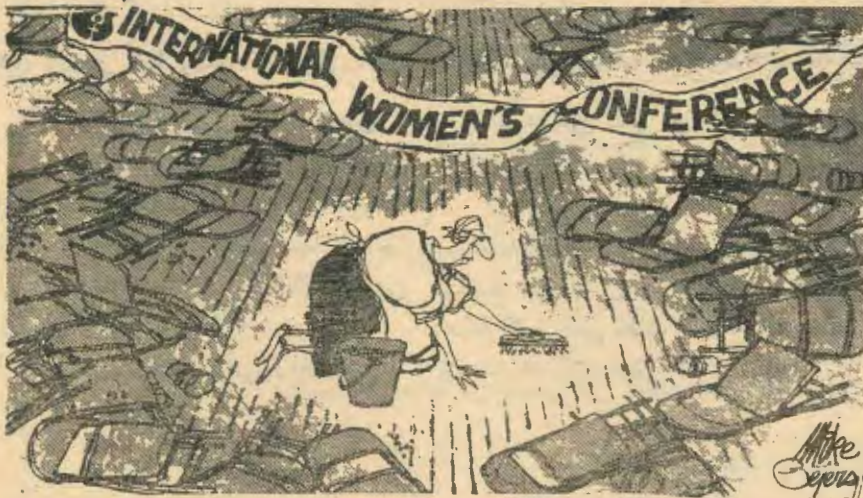
عام المرأة العالمي

الان ، لندع السياسة ونتحدث في شيء آخر . — الاقتصاد