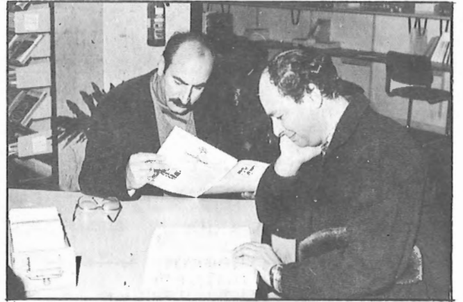
أساتذة الجامعة يستطلعون "النشرة الداخلية" في مكتبة الجامعة .

* تم اعتبارا من ١٤/١/١٩٨٦ تزويد غرفة رقم (١١٤) الموجودة في الطابق الأرضي في مكتبة يوسف أحمد الغانم بعدد من أجهزة "قـارـىء ميكروفيلم وميكروفيش" وهي جاهزة للاستعمال .