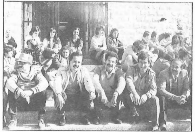
بعض أساتذة وموظفي الجامعة في اعتمام أمام مبنى الادارة .

" اننا لا نزال نرى أن مجلس الأمناء لم يعمل كل ما في وسعه للخروج من هذه الأزمة بغض النظر عن الذي ذكر عن وجود صعوبات خاصة بعد الرحلة المشتركة بين مجلس الأمناء ونقابة العاملين والتي أثبتت صحة وجهة نظر نقابة العاملين في طريقة حل الأزمة المالية حيث استطاع الوفد الحصول على أموال واجراء ترتيبات للحصول على أموال في المستقبل، ويجب تجري محاولات مماثلة في بلدان أخرى مثل الكويت والسعودية، وقد قدمت نقابة العاملين ورقة عمل حول تطوير سبل