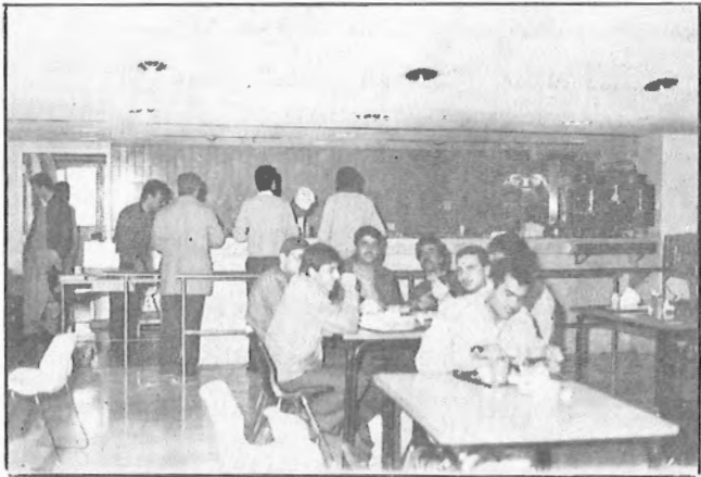
المقصف الجديد في الأيام الأولى من افتتاحه .

افتتحت دائرة الخدمات العامة في الجامعة بتاريخ ١٩٨٦/١/٤ مقصفا جديدا هو مقصف كلية الهندسة، الهدف منه خدمة طلبة وأساتذة وعاملين كليتي الهندسة والتجارة وتوفير الوقت والجهد على طلبة وأساتذة هذا المبنى خاصة في أيام الشتاء، كذلك تخفيف الضغط عن المقصف المركزي.