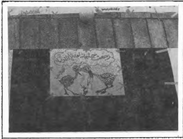
من كاريكاتيرات الكتلة الاسلامية