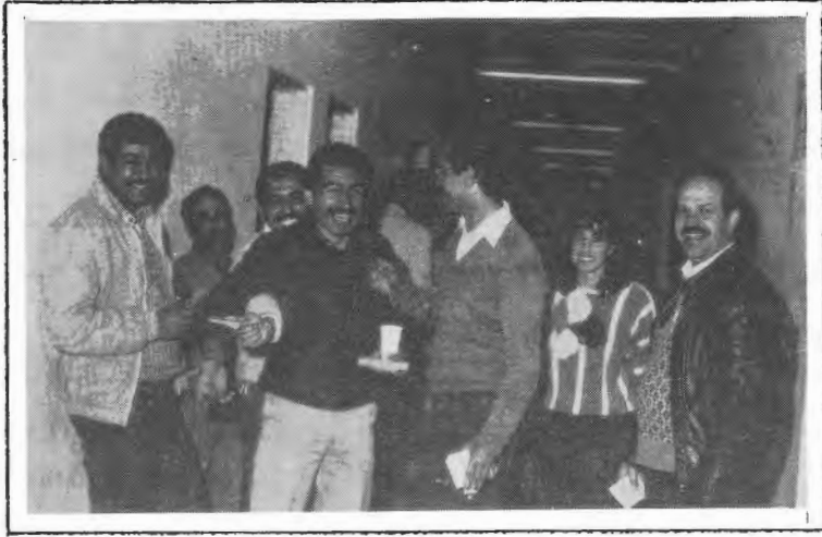
بعض مرشحي الكتلة الوطنية النقابية