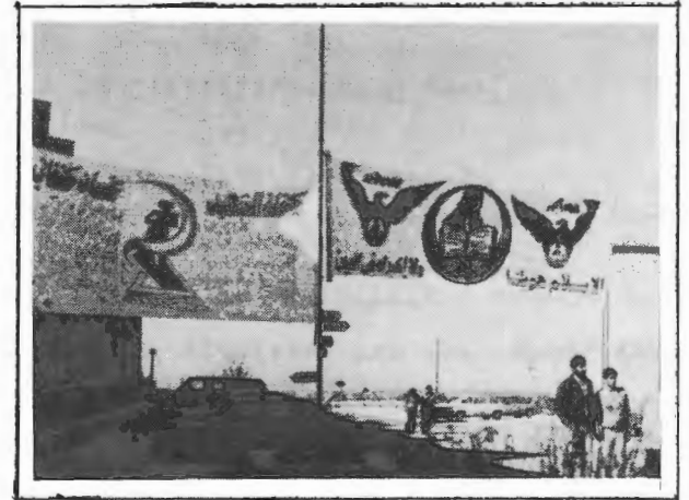
دعاية انتخابية /مجلس الطلبة

(التقطت عدسة النشرة الداخلية هذه الصور خلال الدعايات الانتخابية لنقابة العاملين ومجلس الطلبة .)