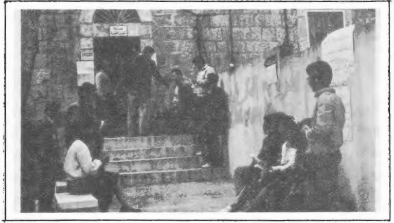
انتخابات الهيئة الادارية لنقابة العاملين، الحرم القديم