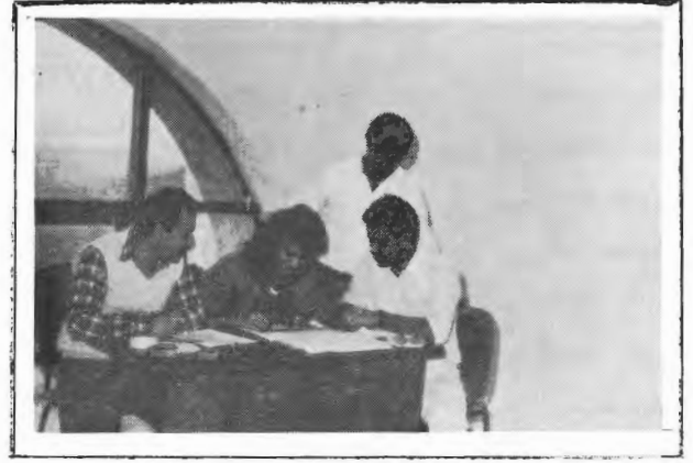
اللجنة التحضيرية للانتخابات