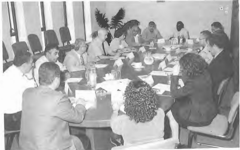
أثناء الإجتماع مع الوزير الضيف

قام بزيارة الجامعة في ٨/١٠/٩٩ اللورد ديفيد سانزبيري وزير العلوم البريطاني، يرافقه روبن كيلي القنصل البريطاني العام، و سوريش خاننا من المؤسسة التجارية الدولية البريطانية، و باتريشيا موريسي المساعدة الخاصة للوزير البريطاني، وديفيد مارتن مدير المجلس الثقافي البريطاني، وذلك بهدف النقاش والتباحث في الشؤون العلمية مع الدكتور حنا ناصر رئيس الجامعة، وأعضاء مجلس الجامعة، ولبحث إمكانيات الدعم في مجال الأغذية والتدريب لوحدة مراقبة نوعية الأغذية في مركز صحة البيئة في الجامعة.