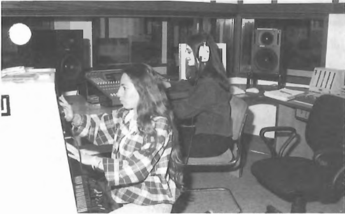
طلبة الصحافة أثناء التدريب

وتقوم الوحدة بنشر صحيفة "الصحافي" وتوزع في مختلف المناطق مع الصحف اليومية شهرياً.