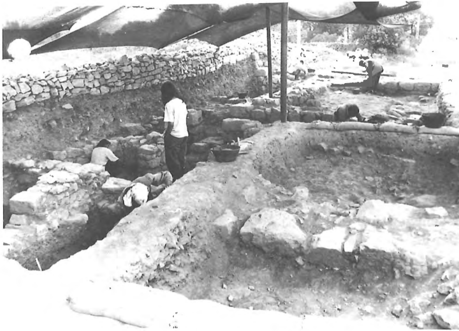
جانب من التنقيبات في خربة بيرزيت

من الجدير بالذكر ان هذه التنقيبات دعمت من قبل مشروع فلسطيني نرويجي مشترك وقدم لها الدعم ايضا من قبل وحدة دراسات البحر الأبيض المتوسط ، ومن صندوق التنمية الكندي.