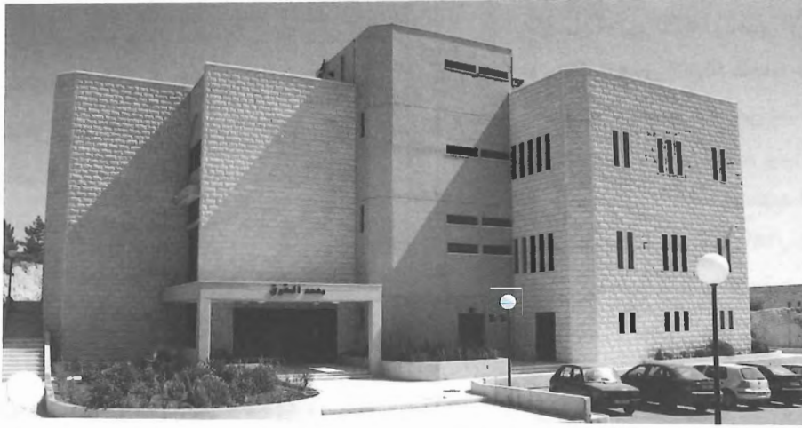
مبنى معهد الحقوق

شارك في هذه الورشة كل من، القاضي نصري عواد عضو محكمة الاستئناف المنعقدة في رام الله، والقاضي اسحق مهنا، رئيس المحكمة المركزية في مدينة غزة.