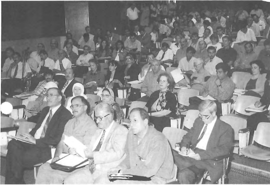
جانب من المشاركين في الحضور في مؤتمر تقرير التنمية

يُنتج هذا التقرير. وقد تم حتى الآن إنتاج ملف التنمية البشرية - فلسطين ٩٦ - ٩٧، وهو ملف وصفي لوضع التنمية في فلسطين. أما هذا العام فقد أصدر برنامج التنمية تقريراً عن التنمية البشرية في فلسطين يركز على نتائج إحصائية ورقمية أكثر منها وصفية.