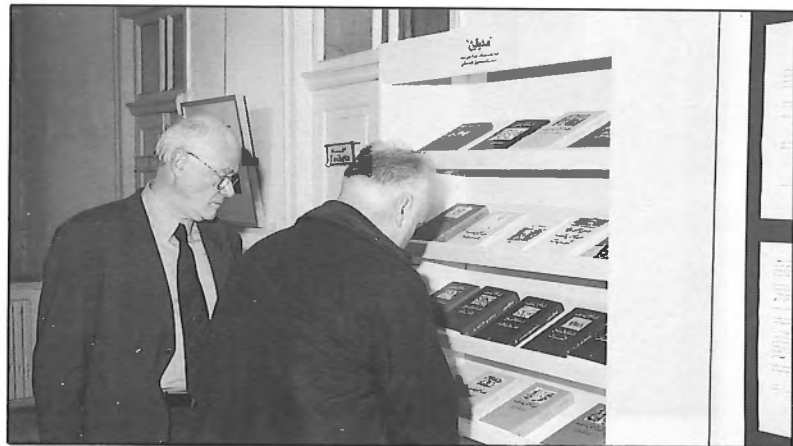
معرض مؤلفات الكاتب عبد الرحمن منيف، رافق معرض الرسومات

وأقامت جامعة بيرزيت معرضا خاصا للفنان مروان في شهر نيسان من عام ١٩٩٨ في كل من الجامعة ومركز خليل السكاكيني الثقافي، في رام الله، بالتعاون مع معهد جوته، عرضت فيه مجموعة مكونة من ٧٥ لوحة للفنان مروان في الجامعة، وعرضت مجموعة أخرى في مركز السكاكيني.