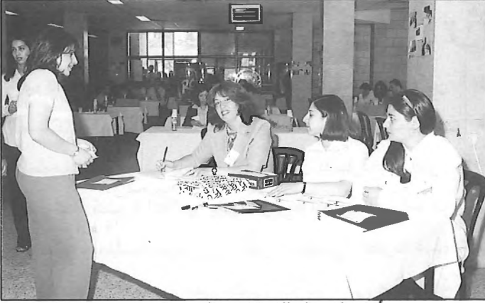
أثناء التسجيل للشركات والمؤسسات