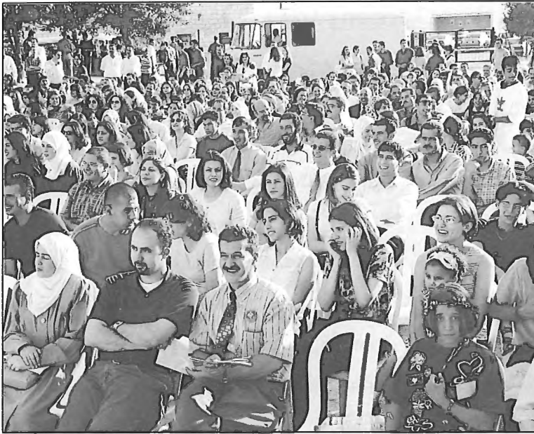
عدد من الخريجين وعائلاتهم يشاهدون فعاليات اللقاء