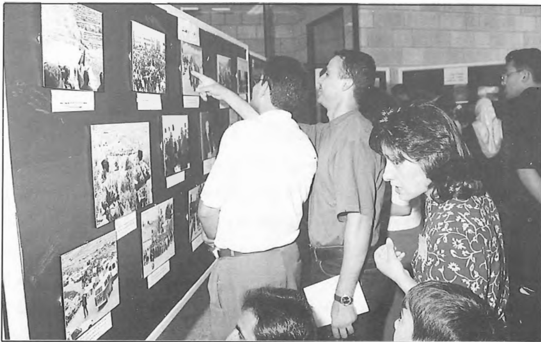
جانب من معرض الصور المقام بهذه المناسبة