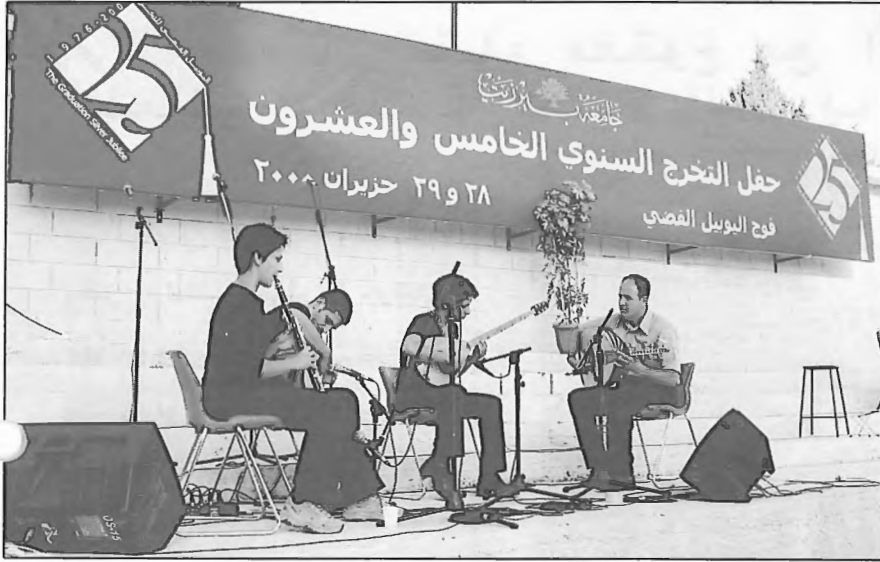
جانب من فقرة فنية موسيقية قدمها خريجو الجامعة

لأطفالهم التي امتازت بالكثير من النشاط والحيوية واتخذت منها مهما جديداً في رعاية الجامعة لأبنائها الخريجين عبر الاعتناء بأبنائهم، من رسم وفن وألعاب رياضية ونشاطات ثقافية.