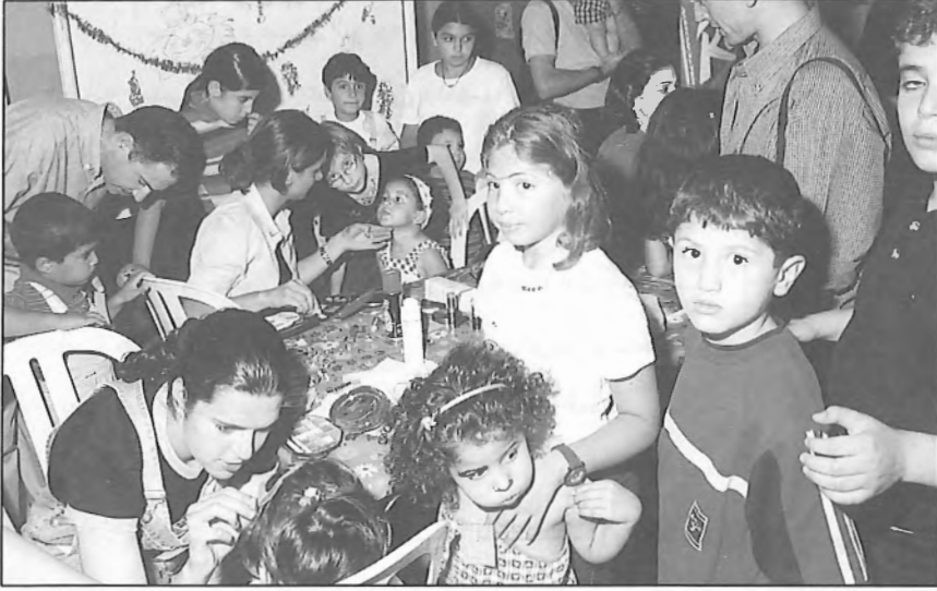
فعاليات مختلفة للأطفال في ردهة كلية عمر العقاد للهندسة

لأطفالهم التي امتازت بالكثير من النشاط والحيوية واتخذت منها مهما جديداً في رعاية الجامعة لأبنائها الخريجين عبر الاعتناء بأبنائهم، من رسم وفن وألعاب رياضية ونشاطات ثقافية.