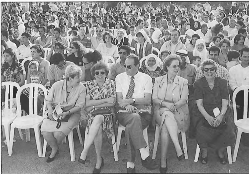
جانب من الخريجين والاداريين والمدعوين في يوم اللقاء

وكان هذا أول لقاء نظمته الجامعة للتواصل مع خريجها بمناسبة مرور خمسة وعشرين عاما على تخريج الفوج الأول عام ١٩٧٦. وقد رحبت الجامعة بخريجها ووصفتهم بالأوائل والبناء وأعربت عن فخرها بلقائهم. وبدأت المئات من الخريجين جولتهم في قاعة كمال ناصر حيث تم عرض