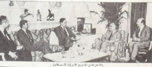
والانحراف في التناقض الابراركية الاستيعافية

جامعة اليرموك التي تحفلت بتحركهم السابق، عن طريق اضعاف القدرات الطلابية وتقليد استقلاليتها الحفمات الطلابية وحرة نشاطها. ان الامران في السبع على طريق اهل الأمريكي وفي سياسته مع الشعب وقوله الوطنية لسطحة، يستحق عرافاً أرسطوياً رسماً من الحركة الجماهيرية، في عرض الأوساط الحافظة التوافقية للقطام. فهذا الميزاج يربح الأردن في عداد صريح وتناقض مع مصالح الشعب الفلسفي وحقوقه وتطلعاته الوطنية. فبعد، وإنما يهدد الأردن نفسه، ويفرض وحده المداعبة، ويضع اليأس أمام الغزو الصهيوني ويجرم من انتهاكات سيئاته. لذلك ليس المستغرب ان تتصير إسرائيل طلبية جامعة اليرموك بجانبها المرموح، الخطي المتشدد (مطالب كاديسية وديمقراطية خاصة عام، والوطنية، حيث على هذا الصعيد ليست الجامعة مسبوقة الجماهيرية الداعمة للشعب الفلسفي ونورته الوطنية ومطالبه وحقوقه المشروعة التي كان تحركهم مركزاً مؤثر في بداية أثارها الخاصة، وهذا ليس - خلافاً - احقاق عوارث الابدان الزامية طلبية الخطية لفرطهم وعدها الطلبة ايدان تحركهم الجديد الأخير.