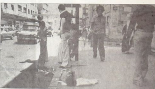
خلفه زحف الأوساط الاقتصادية

المتحرك، بعد اتفاق ١١ شباط ١٩٨٤، فان هذا وقد التمسح عز عراف الأوساط الجماهيرية الأوسع من حضوره اعدام السلطة الحاكمة على حظوة القومية الاستيعاف على طريق اهل الأمريكي. ذلك ان الحفلة لتصبح وعامة قيام ايداه لسطحية الثورية، سوى الاستيعاف في طريق اهل الأمريكي يتعدول باروا لتسبح له وجوده هناك، فلسطية وعربي ما من ناحية اخرى، جاء تصعيد الحفلة القسمة ضد الخطباء الجماهيرية والقائمية والثقافة والطلاقة وعند القوى الوطنية لسطحة على مدار فترة العام مؤثر على ان الأوساط الحاكمة تستهدف تهيئة الأجواء وتهدد الطلبة اسام الفصاحيا في طريق اهل الأمريكي والصفحات الاستيعافية - الأخرافية. ان التقليل المتزايد للهامش التنسي، الضيق أصلاً، من الحريات، والتدخل الفظ والفرط في شؤون المطاهير الجماهيرية والحملات المدعولة المتكررة على القوى الوطنية في البلاد، تدخل في اعلان سياسة متشاكسة الحفلات تستهدف اطلاق يد السطحة في الاستيعاف على طريق اهل الأمريكي. وفي هذا السياق تأتي فعاليات الأجهزة المدونة لفرطهم مكشبات حلة