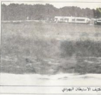
مستمرة اسريريه عرب عمكا، لثمة لثمة اليهودي