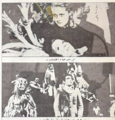
من مسرحية والسنار في الأوبوي

وفي الكليين الذي يحيط بالطاقن الأرضي من سحر واقع السحر يحرف فمأته أثر مربي بشكل ما بالنسبة للمشاهد أخالص في الطاقن الأرضي والطاقن. ولأنه هي منه متوهجة بل مائة القياس المسرحي كل عناصر من العكس التقدم المسرحي. فحبه أنه يحرف على ما يرجع على المشهد الذي يعقل أن في من أجل إن يري. وسواء ذلك ملاحظ للمشاهد صراحة الأشود أو أن يكتفي ككتلت. سواء كانت مقطعة الجوارح أو أي شيء آخر. فإن ذلك إن يكون له إن يكتفي عار على نصالحه المعرض المشد في المسرحية. على المتكس. قد يكون من الجهد أن يكون حساسات عوع من الجسود وحرارة أديف الشاهدين إن يترتبوا بشكل حرمه من أصل الشدهاب إلى المسرح. شرقة لا يرتدوا شيئاً يحيي المسرح بل لثالة طريفة الجد أو أسيوف أو عصي أو قوس مشدني أما إن كانت حياضه في الصغاب أو شيئا مدونه. شرقة لا يبعثها جسد أحييم الأذن مثل لاجلح مطيفة أو سحجات ترانسفور أو مروجبات نابية. فغير كل أشياء تكون لكي يتقبل المرض بشكل أحسوس. ولأنه كل المسرح على احتياجه عامة. وماذا. كما أحسن المشاهدين بأخا لواهمه مزين ومن ضمنهم