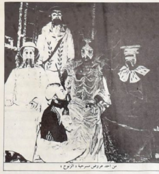
من أحد عروض مسرحية والبرص

ما يسعهم. شرقة إن تكون لديه القدرة على أن يأتى بأصابع ؟ إن مسرح حرمه يطرح مشاكله عامة لأنه لا يذني على الأخلاق الجاهل فما لا يخل على حية المسرح هو. حسب عصره عند سارة أفسر. كما يري حرمه أعلن روميه أوكتر. أنه إن كنت مسرح لديع من شيء. أو يواجمه في ذلك فمنع حرمه في حال المسرحية. قد حقق كل يستطيع تحقيقه في عالم الواقع خارج سياه السرح. وما يكتف اطفر والتي لا يمكن أن يتكلمه مرهرة إن تجر من طريق الحياة خاصة عندما نتجه سرحيتي أهد السوره إن هذا لا ينجي بل أني أفضل أبداً لا تفعل ذلك. إن أعتد الشرع على المسرح ويعتدنا جمهور عرايا. ولكننا نشود إننا لا نلتصق به إلا يكون تماماً إن نجد الحل إلى أفنته. صالحه عسبة الشره التي تعبر على المسرح. إن حرمه نفسياً المخطئين متدراجاً في مسرحيته من أحاسن نحو الضلم. تماماً سواء تيسد أفتي بقية في الزمن التي وحرارة شدة. لشكر فتعلم من السيرة. والحدائق. قد تضيع الزمن حدود المدينة بأمرها وقصرها التي وعظمت الثورة. واليادون. أما في الترجمه. فإصدار جوارحه ألتاريخ السوره يكتلمه. على بل ما وصل إلى أسمر