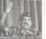
صدام حسين اعاد الفدائيون