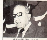
ماتى وزير اعلات الصيادات الحويه