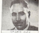
عد الصرحان عد تطريق الصرحان

ورعدوا حاسماً تجاهاً بسلام الوحدة القطبية وبمواصلة الضلال على تحلق جمع مطهرهم . كما الخدمان شامكة مخلص ( كفتريا ) الحماضه مؤقماً الاعتصام . ورم الاستيعاب الترسمة الى معتقل تلك الليلة الا الطلبة بانرا الى دخول مالي الحماضه على بن لهما بانحماضها عوا .