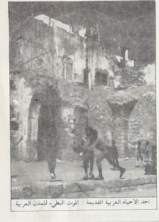
تجمع احياء العربية القديمة، اريحا (الجزء العربي القديم)

البحر، والثاني من الشارع ٢٠٠ في شارع باغ، والذي الاحتلال طبات لثمة وهذا على ارض القري العربية وموحداً بما اصحابها في مستخدمو، او يعرضون الا اصرهم بقرارهم مخبرية لا تسبق الزرامة، وبذلك استولت على مناطق واسعة داخل القري العربية.