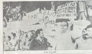
التجمع جا برك

يوماً ، بعض باطلون بحرية الثانية وعلا، بعضاً اغتزل من سلباتهم. الغلاب باطلون بحرية الثانية، وينديتراطية الموقف ووثيقه. النساء باطلون من اللوح الجناح والخنازير. من خان القويون ، في خان الحامسة، احتلال سراج السجدة السيباسيين ، ، وكان يخلط بالديتراطية ويرحل البيكتاتور. والكنيسة الكاثوليكية كان يخلع حجاب اغراض الصراخ. حتى لوغني على طريقه. فقد تازمت مغربوا في العدالة والديتراطية . بعد أن وصلت الامراتي حدود تدفق على الكرك والبلوك مستلك الخلفين ، في كيزاكوا. ولقد امتد حدة من رحيل المعلم والكتابة والبعثات واستلمت الاممات بدأت تحرك . وكأيا انتظرت سناً اجنبياً قوياً ، مستغلاً في حركة الجبهة البريادية ، حتى تنطق غلمات نظام . وعلى طرفها اجبا ، مزيد من الحريات السياسية ، والمخروج من الخلفة الغلابية ، حتى فرضتها الديمقراطية ، حيث صورها واخبرها تنطق كل الصفح والاممات ، والبرامج القومية، والبرامج الدرامية! برغم فضائحات رحيل الاقتصاد والاجمال بدأت بالتحرك قسمة القلب المنطق . ولقد استولى اللاد أدت إلى حرب شاميل في صماعات نطق الحجوم، وصماعات الينا ، والنظان . وصماعات التماسه التي كل الصماعات الاخرى . وانتفاخ السراج الاوالة اعاداً . عانياً . كاتلغف وطبقه والبرامد التي تمتد لقطاعات اقتصادية كبيرة على قمة لقطاعات اخرى التي هي حرب شاميل . وبالمقابل اعاد ارتفاع السراج الاوالة في بلاد السورودة ، التي اطلق بيوتها ، وعلى فلاح في الفزان البحري ويزون المنطوقات . حتى انضم اقتصاد البلاد الى الصماعات التي من كسر في . الضخم من الصماعات الغلبة . والقطاغ . وتفضيف الخمسة ١٠٠ سواً ، الى ما عاكف من . امراض ، لانتهتها في دولة من الدول