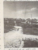
عائلة من النصارى، قديم، قديم في القرون العشرة