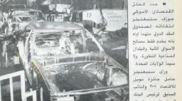
الحد الصناعي في منطقة هيرم جنوب لند

عنوان الحملة الضوئية العمادية لفرنسا أخباري. تتجه فرنسا نحو استراتيجية جديدة في العلاقات الدولية، تركز على تعزيز دورها كقوة عالمية متوازنة. وتهدف هذه الحملة إلى جذب انتباه الرأي العام العالمي نحو القضايا التي تهم فرنسا، مثل الديمقراطية والتنمية الاقتصادية.