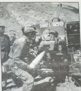
الجيش الهندي: التصاميم الاستراتيجية للسلح الإسرائيلي

تعاون استراتيجي بين الهند وإسرائيل في تصنيع مركبات صيد كبيرة الحجم، وهو ما يندرج ضمن برنامج التعاون العسكري بين البلدين. وتعد هذه المركبات من أحدث التصاميم التي طورها الجيش الإسرائيلي بالتعاون مع الهند، وهي قادرة على حمل وتوجيه صواريخ مضادة للدبابات. وتأتي هذه الخطوة في إطار سلسلة من الاتفاقيات العسكرية المبرمة بين الجانبين، والتي تشمل تبادل الخبرات والتكنولوجيا في مجالات الدفاع المختلفة.