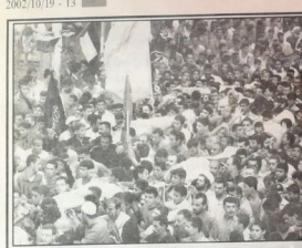
صباحه جرمه في الامل - سطوره تصديقيه خيليه

انكرت في اسرائيل انكرت في اسرائيل انكرت في اسرائيل انكرت في اسرائيل انكرت في اسرائيل انكرت في اسرائيل