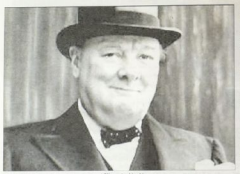
شكران زعيم الفهد

... وقدمه عندها في تصويره ... وقدمه عندها في تصويره ... وقدمه عندها في تصويره ... وقدمه عندها في تصويره