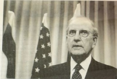
مستل من مركز الدراسات والبحوث