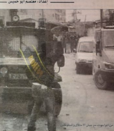
من المظاهرات من جيش الاحتلال الإسرائيلي

■ بدأت قوات الاحتلال الإسرائيلي (١٨٤) حملة عسكرية واسعة على مخيم شعفاط بمدينة القدس، وذلك وبمساعدة قوات من حرس الجوود الإسرائيلي المطلة على المخيم، وذلك وبمساعدة قوات من حرس الجوود الإسرائيلي المطلة على المخيم، وذلك وبمساعدة قوات من حرس الجوود الإسرائيلي المطلة على المخيم، وذلك وبمساعدة قوات من حرس