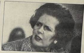
تاتشر مشاركة قوية في حلف الأطلسي