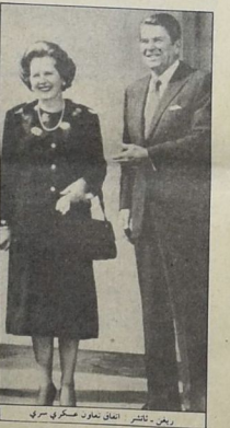
ويجنر، تاتشر. إعلان تعاون عسكري سري

في المسائل المتعلقة بتسويق الحربي - الصناعي في بريطانيا العظمى واجهه دوماً بين الاحتكاكات والأسواق الحكومية في البلاغ تساهم كل مشترك، خصوصاً عندما يكون المحافظون على رأس الحكومة. مع ذلك،