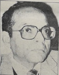
رغم التجديد - يواجهه سيركا وليس معركة انتخابية

نحن نواجهه ، سيركا ، وليس معركة انتخابية . الفاتون يعد المعاني نحن ، منذ البداية ، اذ كانت الفاتون المعدل غير دستوري بالتصديق . فكذلك نحن اننا الذين نبي على اساس غير دستوري سابق ، فكذلك الجهاد غير الدستوري . وهذا جهار غير دستوري . وكما عطف على الدستور ، فمعلقا لاسمهم ولذا اوتامة سطحت بالسياسيون الجديفة وسنحتم المحكمة بعدم اعترافها بغير الدستورية ، ولا يكون امامهم سوى ان يخلوا المجلس بعد عين اول ثلاثة ، وهي الحقبة التي يستعرض عرض الامر على المحكمة الدستورية العليا .