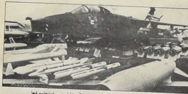
الضباط العسكرية البريطانية (١٠٠٠) في باغرام على استعدادهم لها