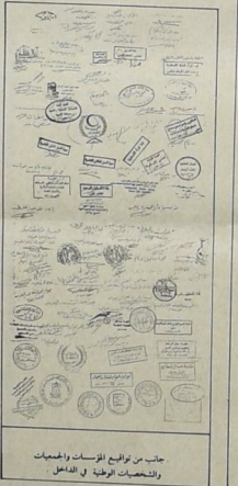
جانب من توقيع المؤسسات والهيئات والشخصيات الوطنية في الداخل

٦ - تستندت الرأي العام العالمي والقوي والقيادات الاقليمية للعمل على وقف الحرب العرصة وازالة الحصار واقفاه الضيق الذي يتعرض له شتيا في لبنان ،