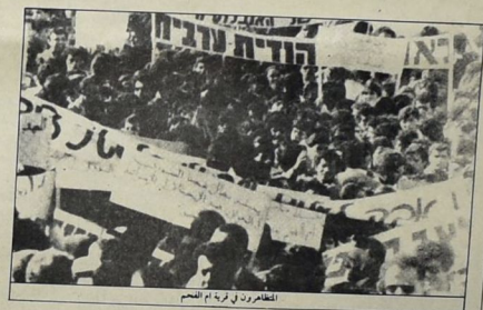
المظفرون في قرية ام الفحم

احتفلت جماهير الشعب الفلسطيني في الاراضي المحتلة وحارمها بالذكرى احدى عشرة لثورة يوم الارض التي صادف مرورها في ٣٠ آذار المنصرم. حيث كانت الجماهير المنتمية في الضفة الغربية وقطاع غزة والقدس المحتلة عام ٤٨ ، تسكها بالارض وضرب كافة اجرامات ومخارسات سلطات الاحتلال ومشروع وسامسي التضييق والعقوبات الفلسطينية بين الاردن وسائر اقطار ، وعمليات نقل البضائيل الرسمية لمنطقة البحر المتوسط الفلسطينية كما كتبت هذه الجماهير اسكها بالنطقه كتمثل وجد للشعب الفلسطيني وتأييدها كاتاة الحظوات الرسمية. هذا وقد سبق الاحتلال هذه الناحية الفلسطينية العديد من التحركات الفلسطينية والمظاهرات والمجمعات القومية ضد جود الاحتلال واليه في المناطق المحتلة.