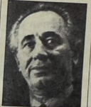
رأس العمل يتناول ان يظهر موحداً ، ورفض خلف قيادة شمعون بيرس وقت فتح حله

رأس عصاة الحزب ، ويسود الاعتقاد بأنه اسحق راين يلف وراء الانتقادات والحلقة عند بيرس غير ان مصادر قريبة من راينيين استبعدت ان يكون موضوع التناقص على الرضاة واذا في هذه الفترة وانصفت ان شمعون بيرس راينين توصلا الى قاعدة معل بأنهم عليا للبر