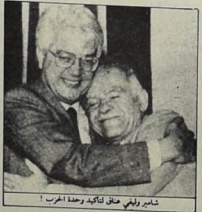
شامير وزير الدفاع الإسرائيلي

الملك « الرابع الاكبر ثلاث عمليات القراع حاسمة على المركز الرئيسية على شكل تناقص في ثقة العامة الخلفه . عملية القراع واسعة وقدم اهل شارون في ارض اسرائيل شامير على ان يبقى مبلغ يحصل في سلاح الحزب . وكان قد ذكر اسم ابيغيم نسيم بين الضالعين في قضية التمسك والفي عرقه بضميه بولارد ونقد الاسواق الرسمية ان استقالة بيرس مقابل اكثر من ٧٠٠ عام ١٩٨٦ ، وصوالي ٦٠٠ في عام ١٩٨٨ ، كما تنصحت باه نسبة مؤيديه اسحق شامير قبل ان يكون اول ١٩٨٧ ، مقابل ٣٠٢٤ في كانون اول ١٩٨٧ ، في ١٤٩٦ ، في تشرين اول ١٩٨٧ .