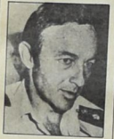
شامير وزير الدفاع الإسرائيلي

في تطور جديد لس في اوساط الرزي الغمام الاسرائيلي حول المنسرف من شمعون بيرس اسحق شامير ، ذكرت صحيفة هارتس ، ان شعبية القائم باعمال الحكومة وزير الخارجية شمعون بيرس قد تسمرت جدا . فقد اصبح ميدان العمل يسريون عن ارتياحهوا للعمل بيرس الآن أقل من ٥٠ ، كندلته اخفقت رئيسة الحكومة اسحق شامير ، وبالغالب قبل توليه المنصب في الحكومة ، قوبل بالهتف الشديد في كل منزل ولوزير المالية يشوشه نسيم مسكر الوزراء ابراهيم شير وجدهون بات وشوشيه نسيم وادم حضور الكونغرس اوربيل لير الحزب ، كما انهم لم يجدوا مركز الحزب ، وهم رجال العمل في مشهدة الأبحاث ، بري ، في مطلع شهر آذار .