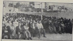
جانب من الحضور في مهرجان عيد الأرض

■ رغم استمرار حرب الإبادة والجوع، التي تشنها فصائل حركة أمل، ضد المخيمات والوجود الفلسطيني في لبنان، واستمرار الحصار الممنهج لخميس جرح اليرزينة، وشيخان في بيروت الغربية ومخيماتها المحيطة، ورغم هذا الوضع المأساوي الذي يطغى به المخيمات، ورغم عدم المرحلة الرابعة وغربها، استمر جماهير الشعب الفلسطيني في لبنان، في إقامة الذكرى الحادية عشرة ليوم الأرض، والتي يهبطه في مخيمات العديد من المهرجان الاحتفالية الخفيفة، كما صدرت عدة بيانات، بعد التنسيق من قبل فصائل الثورة الفلسطينية واللجان الشعبية في المخيمات الفلسطينية في لبنان.