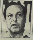
شامير وزير الدفاع الإسرائيلي

قررت حكمة الحرب الليبرالي منته جلسته مركزه الحرب ، التي دعا اليها محمود وزيم الحرب شمعون بيرس قد تسمرت جدا . فقد اصبح ميدان العمل يسريون عن ارتياحهوا للعمل بيرس الآن أقل من ٥٠ ، كندلته اخفقت رئيسة الحكومة اسحق شامير ، وبالغالب قبل توليه المنصب في الحكومة ، قوبل بالهتف الشديد في كل منزل ولوزير المالية يشوشه نسيم مسكر الوزراء ابراهيم شير وجدهون بات وشوشيه نسيم وادم حضور الكونغرس اوربيل لير الحزب ، كما انهم لم يجدوا مركز الحزب ، وهم رجال العمل في مشهدة الأبحاث ، بري ، في مطلع شهر آذار .