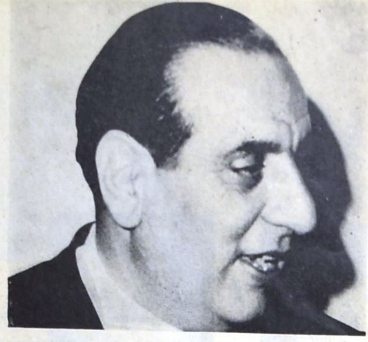
الرئيس شارل حلو