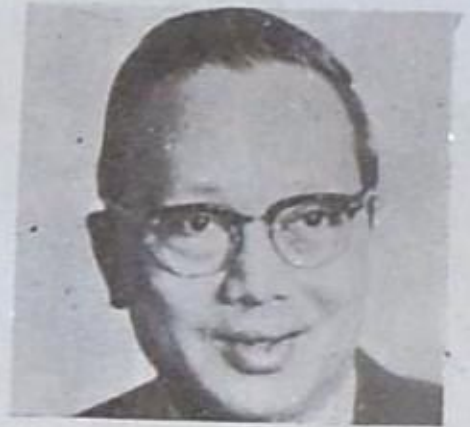
الاتحاد السوفياتي، وقرر ان يقبل الترشيح. وكانت انباء سابقة قد ذكرت انه ربط موضوع قبوله لترشيح نفسه بقبول الدول الكبرى حل مشكلة

اخيرا قرر السكرتير العام للأمم المتحدة، يوانت، ترشيح نفسه للاستمرار في شغل منصب السكرتارية لدورة اخرى ولكن بشرط واحد: ان يقدم مدة ثلاث سنوات بدلا من خمس سنوات، وهي المدة المألوفة. وقد كان يوانت مترددا بالنسبة لموضوع ترشيحه، وكان يفكر بالامتثال، ولكنه عاد فاستجاب لالاح الولايات المتحدة