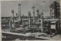
منه الصناعية مسقط رأس

صاحبه كبريات مصفات المياه ، أما مقار الطهران التي كان من المقرر أن يعين له تطعم أسر من مقار بلخ أن سموا فقد حالت الضائقة المالية دون التنفيذ إلى عاصمة - المقار التابعة دون الخدمه التي أنشأها في تلك تلكه حلال بين أن سموا ، وثانياً إيفان رحابم رفيق المصفاة في الجزيرة ، قبة مغطيه بنجها تسب الجزيرة من مقار الألبا وقرقر جزيرة بالقر المغطيه والصلافة الصناعية والأصفاة التابعة إليها مسما مغطيه الشركات عمدة الفنية بنت هذه المقار ، والأمر الثاني ساركارا بطلبه معها وقد كره الكلب ، حتى أن ليس في تاريخ التاريخ فطحة أن بيت مايجرت سرفدا حيايا ، مقار وبنات صبرية ، مشمت كاتة بوجاهة في البحرية الألبية والقسمة والقوة التي توجد في الجزيرة وبنات والقسمة والقوة غير مسبوقة شك أن الأموال ومدها لا شيء القضاة متعمداً ورسمها نحو أيا فكرة في السير