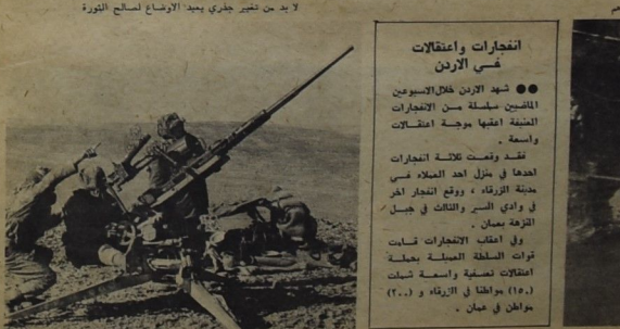
في ابول الجازر .. لم تكن تحارب تلك وجوهه المرفزة وحدهم

ان الجازر الضميمة كانت جزءا مكبلا باستمرار المجازر الضميمة .. كما ان استبدال الوجوه كان دائما أحد مظاهر هذه الجازرة .. الميم ان تركب الجماهير .. ولا يبع بعد ذلك الطريقة التي يتم فيها الركوع . غير الجازر ما غير الاحتواء ! نقد افنانا من النظام الأردني انه بعد كل حفرة يفتحها بحق شيئا في الأردن يستبدل وزرائه المظلمة بغير وزراء الضميمة تكون مبنية فكريا على المور الرسوم لها في الحقبة الثانية من الزاوية ، لم يكر زيادة لتوليد الضميمة لتخرج « قوتها » بغيره تلك التسبب في الأردن محزوا ان بطم يطهر العرسي على الحركة الرجعية ، فمن لمسة « تغير الوجوه المزمعة بوجوه اخرى كانت ترمي بها خلف كباكلها ، وضعت نصب هذا النوع في حقبة تاريخية معينة ، كترجع لداور بشكل نكي . ومن ان الاثرات الواضحة على ذلك انه في عهد وزارة جديدة في الأردن لم تنج الحركة الرجعية من المحاميات الجاحشة وعمل من عمليات التسلب الرجعية وصلاات الامتيازات والتسريعات لسيرة لقيام الرجعيين الامر الذي يوضع ان نظام الأردني لم يتوقف في يوم من الأيام من تبع الحركة الرجعية . فقد كان ذلك التناقل قبل حزيران من القادسين على الحلق الإسلامي بالتناقل مع القوى الرجعية الأخرى في الوطن العربي والعمل على تعمية القسمة الفلسطينية وتجريد القوة الرجعية من وسائل النجاع الآرامية .