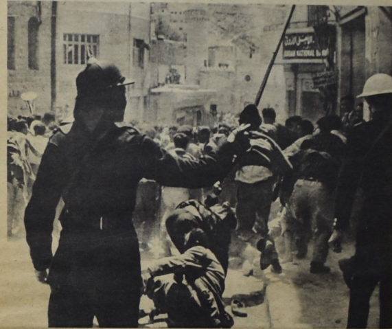
مجلسية للنظام : الميم ان تركب هذه الجماهير ، مهما كانت الوسيلة !!

ان هذا الحصون يجب ان يظل حلقا في اذهان الكثرين بين يرون في تغير بعض الوجوه تغيرا في النظام من قصد او غير قصد ، ونود ان نذكرهم دائما بما استقام الحكم المسكري الرجعي الثنائي الموقل في الخيانة والتامر ، ليس الآن مهمة فداعية تقوم بها الحركة الوطنية لحماية نفسها وحسب ، بل هي مثل ذلك ومعه ، مهمة رئيسية من اجل تغير خريطة الحقة لوريا ، فميريا في خدمة الثورة ، ردا على التفتيش الذي يربط من اجل تغير خريطة الحقة لصالح الامبريالية والصهيونية والرجعية الغربية العميلة .