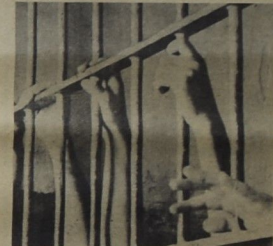
زكريا الخمرات تنس دوما بالآمن المعتقلين

لسيين ، أولها محلي وثانيها خارجي ، ينكم النظام الأردني بشدة حول أوضاع السجون والمعتقلين السياسيين لديه . الإنراف على المعتقلين بجاهزة الأمن والإدارات الفرعية المتخصصة الأخرى ، كما أتبط الأمر أحياناً إقادة الجيش الأردني نفسه ، أسجلبا مع الصور التاريخية الذي لمبه هذا الجيش كجهاز أمن داخلي ليس أكثر . وتنعا ذلك عقد أمنت الدولة بدءا من عام ١٩٥٥ م ، عن نشر أية أرقام أو معلومات حول عدد السجون والمعتقلين (١) ، باعتبار أن ذلك الأمر قد أصبح في نسل الظروف السياسية الخاصة بالآمن أحد أسرار الدولة ، ويعتقد ظروف «الآمن والسلمة العامة» . خارجيا : تأسيا مع «روح العصر» وسبب حساسية الرأي العام الخارجي - خاصة الأوروبي - أولا ، ولأغراض سياسية دينامية أجهوا : ظهوره يظهر الحكم المسند الي قاعدة من الآمن والاستقرار السياسي ، حرص المسؤولين في الأردن دائما على إظهار أقصى لمستد المعتقلين السياسيين ، إذا وجدوا أنفسهم مضطرين في بعض الظروف الخاصة على إعطاء أرقام عن عدد المعتقلين لديهم .