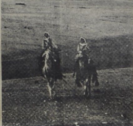
سجن الكسفات التي أدت بحركة الوطنية الأردنية