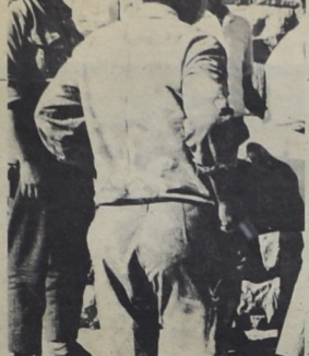
كوك فندا ... تينا لشمار حبيب كلس !

تحت علم الوساطة .. استطاع النظام تنفيذ خطته المحررة لضرب الثورة !!