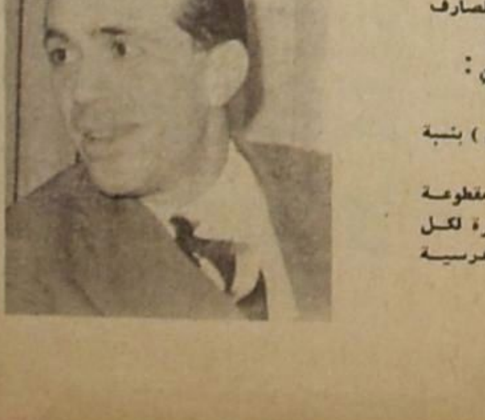
بيار اده : جمعية المتشددين ..

الذكري .. اما ما تبغى منها فيبدو ان اوانه لم يحن بعد ، بانتظار تشرين الذي سينسكل « مفترق طرق » البعض يراه خطرا ، والبعض يراه عاصيا ، والبعض الثالث يعتبره عامصا .. ويحلو لبعض المحذرين في هذا المجال ان يردد حكاية الشاطر حسن عندما وصل الى مفترق طريق واحد منها فقط يؤدي الى الهدف المنشود .. ويتساءل هؤلاء « الحكواتية » : ترى ايكون العهد « محظوظا » مثلما كان الشاطر حسن الذي منح القدرة على فتح كل الكنوز المرصودة بالسحر ، او بما يتبسه .