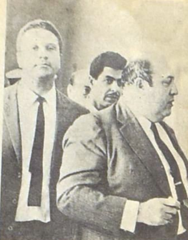
رئيس الحزب الدستوري وبعض الانصار يملكون لانجاح العقيد نجيب الخوري .. مرشحهم .