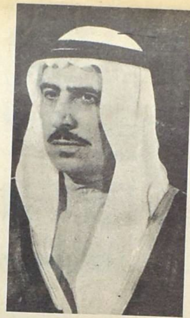
صباح السالم الصباح