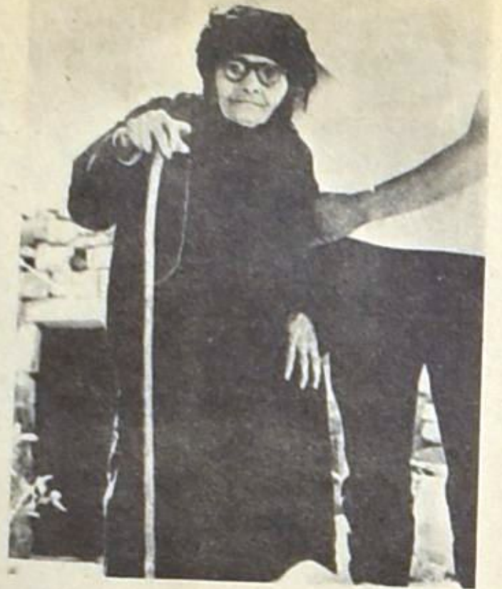
لم يحسن الجيليون كلهم للمعركة ، ولكن هذا لم يمنع بعض المعجزة من انتقام الفرصة