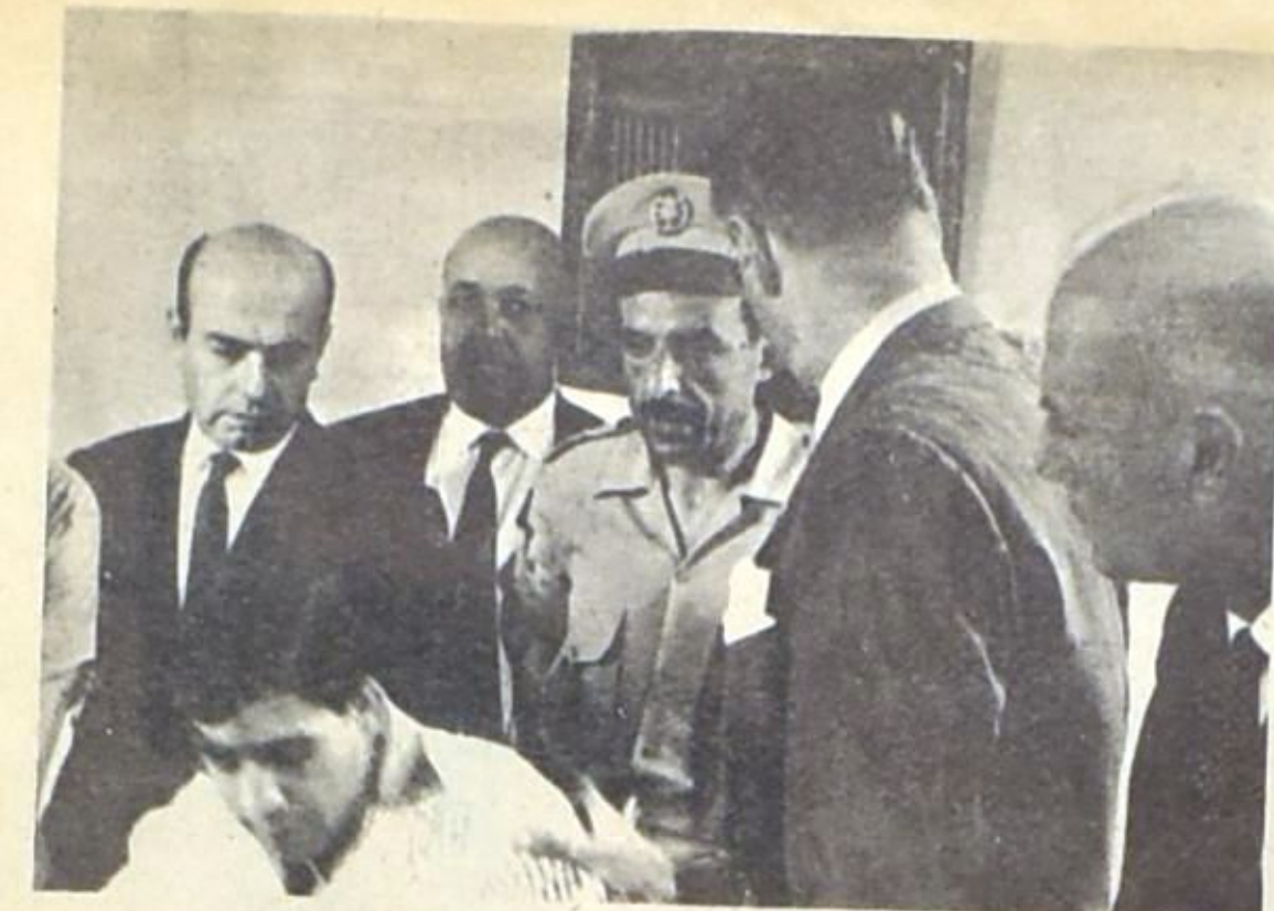
انتقلت وزارة الداخلية كلها الى جيبيل بهدف تأمين معركة نظيفة : في الصورة وزير الداخلية ومحافظ الجبل وبعض الموظفين العسكريين والمدنيين يتابعون اخبار المعركة .. الفرعية !

ان في جملة ما يشغل بال العهد علاقاته بالاكثريين . بل ان هذا الامر بالذات يتعسر « راس هوموم » العهد . واذا كانت الظروف قد ساعدت على جعل « الاثريه الاكثريين » ، فان الظروف نفسها لم تحقق بعد النتيجة