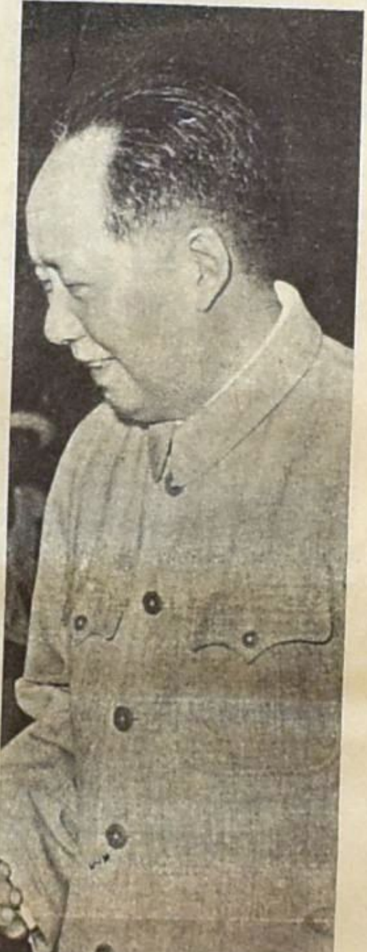
ماوتسي تونغ .. بانتظار حرب عصابات جديدة

تدمير قواعد تموين الفيتكونغ في الشمال . ويعتقد « سنو » بان اقدام واشنطن على تدمير المراكز الصناعية في فينتام الشمالية ، نزع من الرئيس هوشي منه مجال اختيار اي موقف لا تنتهي ، وجعله يتحالف مع الصين وينتشي واياها سياسة مشتركة يتال من خلالها المون والتأييد اللذين يحتاج اليهما مقابل الغراب الذي يلحق ببلادهم من جراء الفسارات الاميركية .