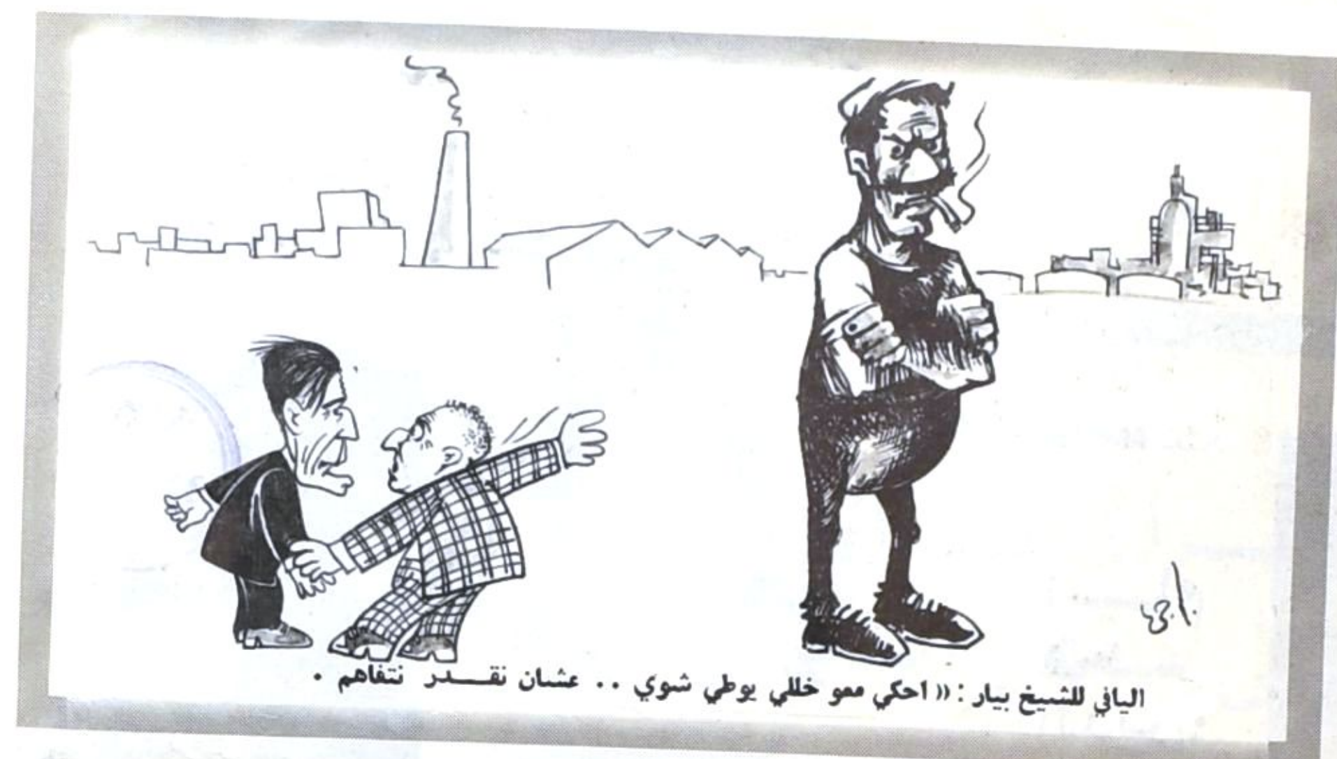
الياني للشيخ بيار : « احكي مو خللي يوطي شوي .. عشان تقدر تفاهم .