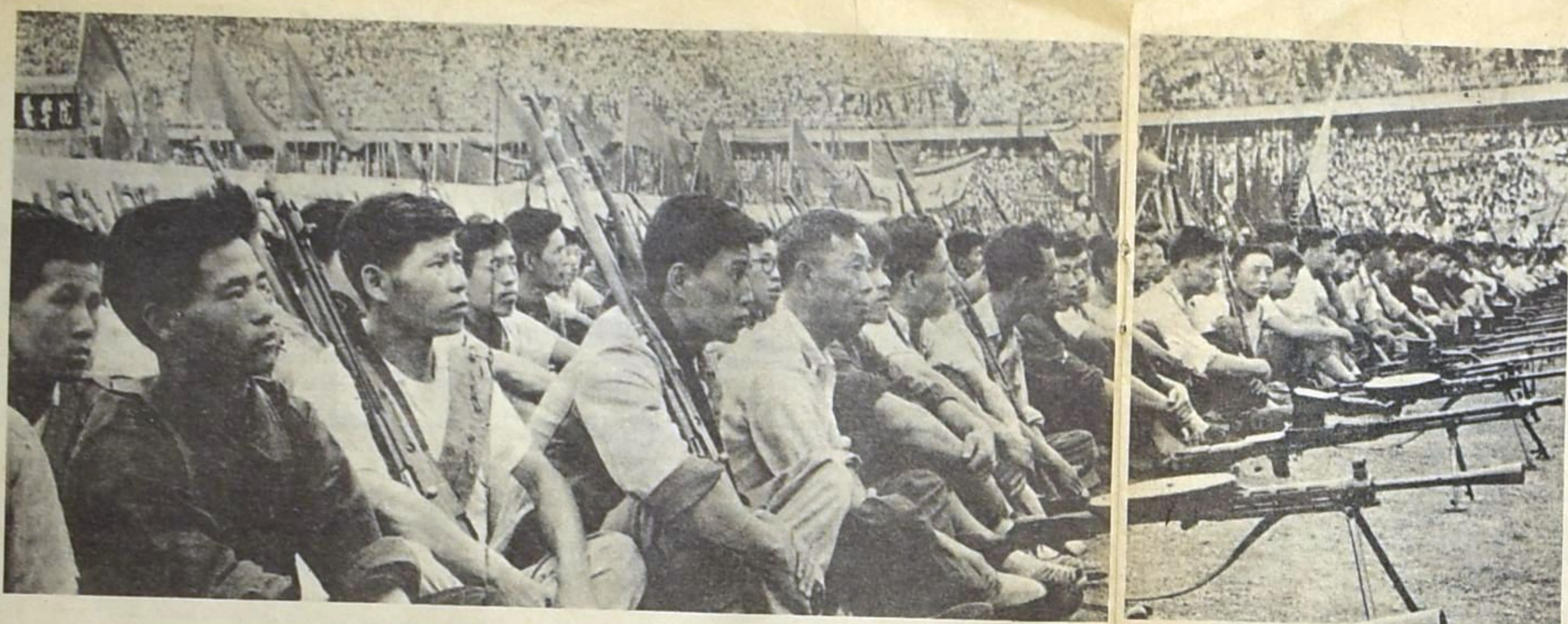
مقاتلون مسلحون بتعاليم ماوتسي تونغ في وجه الغنابل الدرية .