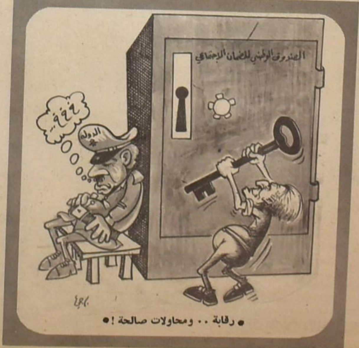
رقابة .. ومحاولات صالحة !

في السطور التالية دون قصد الاساءة الى العمال كقاعدة مرفضة في الشعب العامل ، او الى النقابات كهيئات تمثيلية للعمال : □ المآخذ الأول : ان مندوبي العمال اعتدوا منذ البدء سياسة عجيبة تقول بترك مركز رئاسة مجلس ادارة الصندوق لواحد من ارباب الاممّال .. وهم ، فوق ذلك ، يدافعون عن سياستهم تلك بانقول انهم ارادوا ملاحظة ارباب الاعمال و «الطوريهم» يجعل ممثلهم داخل الصندوق يتبنى القرارات التي تتخذ لصالح العمال ! اي ان مندوبي العمال يريدون نوريطنجيب صالحه - مثلا - مع زملائه وقرانه من اصحاب الملايين ، يجعله يوافق على ما قد يرفضه اولئك الليونيريه لوجاهم كمثل عمالي .. فتأمل !