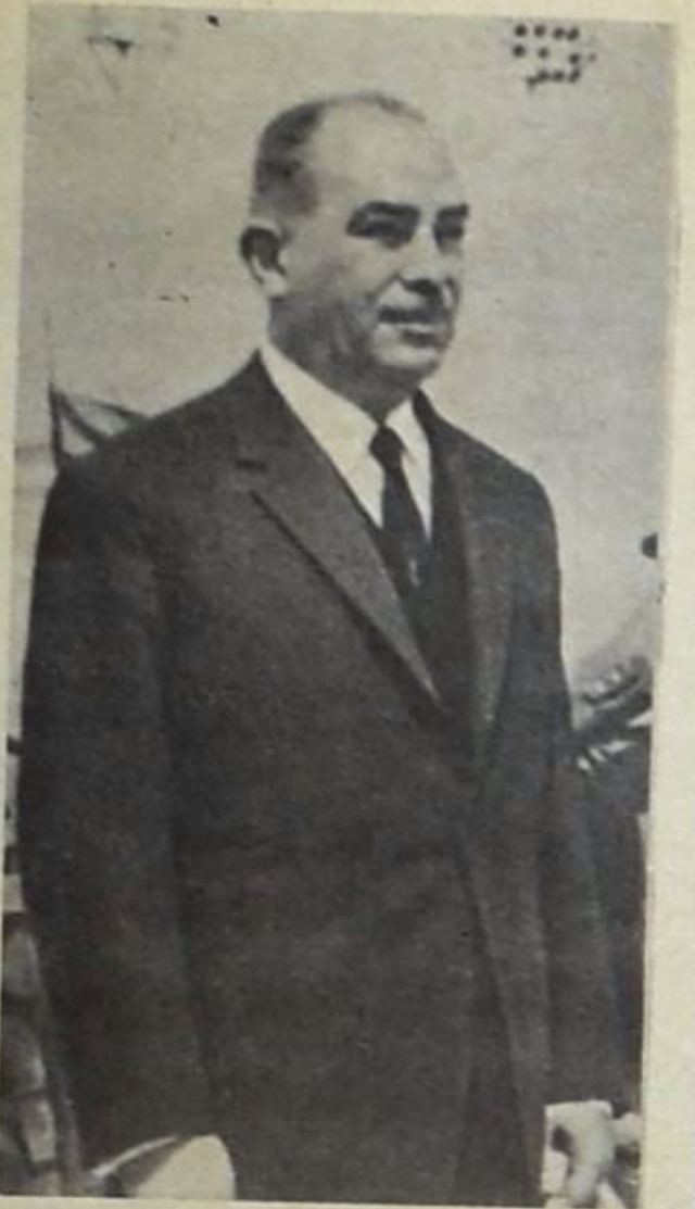
علي صبري : الامين العام للاتحاد الاشتراكي العربي

ان العمل الاساسي في هذه المرحلة الاولى - كما اشار الى ذلك الرئيس عبد الناصر - هو التنظيم . . . ولكن لا يمكن بناء التنظيم الا من خلال العمل السياسي . وقاعدة العمل السياسي الاساسية هي العمل بين الجماهير وسطها ، والاتحاح والارتباط بها واعادة الثقة انهارا وبدورها وبدور الاتحاد الاشتراكي تنظيم سياسي ، خاصة وان السفارة ان هذا الاساس يجب ان تتم عملية انشقاق الحزب الاشتراكي داخل الاتحاد الاشتراكي العربي . . . اي ان يكون الاتحاد الاشتراكي التنظيم الشعبي الواسع الذي يمثل تحالف قوى الشعب العامل فيقسم المنظمات الجماهيرية المختلفة والفئات والحجاس الشعبية ، وان يكون الحزب الاشتراكي الجهاز السياسي والتنظيم السياسي القائد الذي يقود هذا التنظيم الشعبي الواسع . وهذه هي المرحلة الجديدة التي بدأ الاتحاد الاشتراكي يبل عليها من خلال تكوين الجهاز السياسي او التنظيم السياسي . ان العمل السياسي والتنظيم في هذه المرحلة الاولى - كما اشار الى ذلك الرئيس عبد الناصر - هو التنظيم . . . ولكن لا يمكن بناء التنظيم الا من خلال العمل السياسي . وقاعدة العمل السياسي الاساسية هي العمل بين الجماهير وسطها ، والاتحاح والارتباط بها واعادة الثقة انهارا وبدورها وبدور الاتحاد الاشتراكي تنظيم سياسي ، خاصة وان السفارة