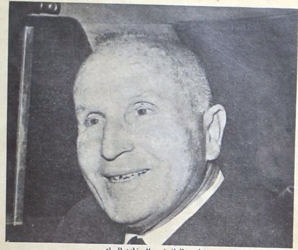
الرئيس الياق: مسافر زاده الساعي ..

لبنان ليس أحسن بخطر جدي يتهدد ليس فقط المؤسسات التي انبثقت عن مؤتمرات القمة، بل وانحامة العربية كلها، ناهيك عن موافقتها واتفاقها التاريخية والخاتمة .. لا دالة إذن لا وساطة! وإذا كان باستضافة القاهرة، مثلاً، وغيرها من العواصم العربية ان تستبدل سياسة مؤتمرات القمة بالعمل التوري . وإذا كان في جيلة أهداف السعودية الانسانية الاستعاضة عن مؤتمرات القمة العربية بمؤتمر قمة اسلامي يهدف الطريق للحلف القعيد .. فان لبنان يحس بالوحدة والوحدة اكثر من اي قطر اخر .. فلا هو اهل للمشاركة، فيما تعززه القاهرة، ولا هو قادر على ازنداء اعمه او انتظار بارئتها ولو الى حين تتحقق تلك الإغراض الكامنة في نفس يعقوب .. الاسلامي! لبنان الرسمي منقذ الواضح في هذا كله : فلقد كان يخشى نتائج «الحاكمية العنوية» التي ستعرض لها خلال مؤتمر القمة الرابع، حول ماتفده - فعلا - من قرارات القمة السابقة سواء على صعيد استثمار روافد نهر الاردن اللبنانية أو على الصعيد العسكري .. اما وقد ذهبت السعودية الى حد محاولة تسف كل شيء ولبنان الرسمي منقذ الواضح في هذا كله : فلقد كان يخشى نتائج «الحاكمية العنوية» التي ستعرض لها خلال مؤتمر القمة الرابع، حول ماتفده - فعلا - من قرارات القمة السابقة سواء على صعيد استثمار روافد نهر الاردن اللبنانية أو على الصعيد العسكري .. اما وقد ذهبت السعودية الى حد محاولة تسف كل شيء