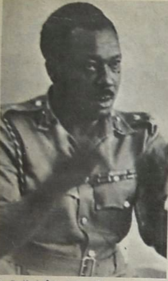
ايروني ... حاكم جديد يهوي في افريقيا

ان سكرتارية المؤتمر لم نال جهدا في توفير جو ديمقراطي للحوار بين المجال للآراء المختلفة كي نأخذ حقها الكامل في النقاش ولو على حساب وقت المؤتمر، سواء اكان التكلم القصى اليسار المتمثل في وفد الصين او القصى اليمين المتمثل في وفد اتحاد افريقيا الغربية . وكان التصويت في النهاية يتم بشكل ديمقراطي وعادل .. ان « اتحاد طلاب العالم » كان طوال العشرين عاما الماضية شوكة في جسد الاستعمار، ولعب دورا بارزا في مساندة حركة التحرير الوطنية ونورانيا ، كما لعب دورا بارزا في مساندة الاتحادات الطلابية التقدمية ونفاذها الشاقفة ضد الظلم التي كانت تحاول خلق صونها ، او عزل طلابها من كفاحهم التقدمي لاجتمع افضل . واذا كان لجموعة وفود ان تعرض على الاتحاد وتعمل لتطويه ، فهذه المجموعة يجب ان تكون هي مجموعة الوفود الغربية ، التي تلعب دورا قياديا بارزا في المجموعة الغربية ، والتي استطاعت ان تكسب الاتحاد الى جانب قضايا الثورة العربية الاشتراكية المعاصرة .