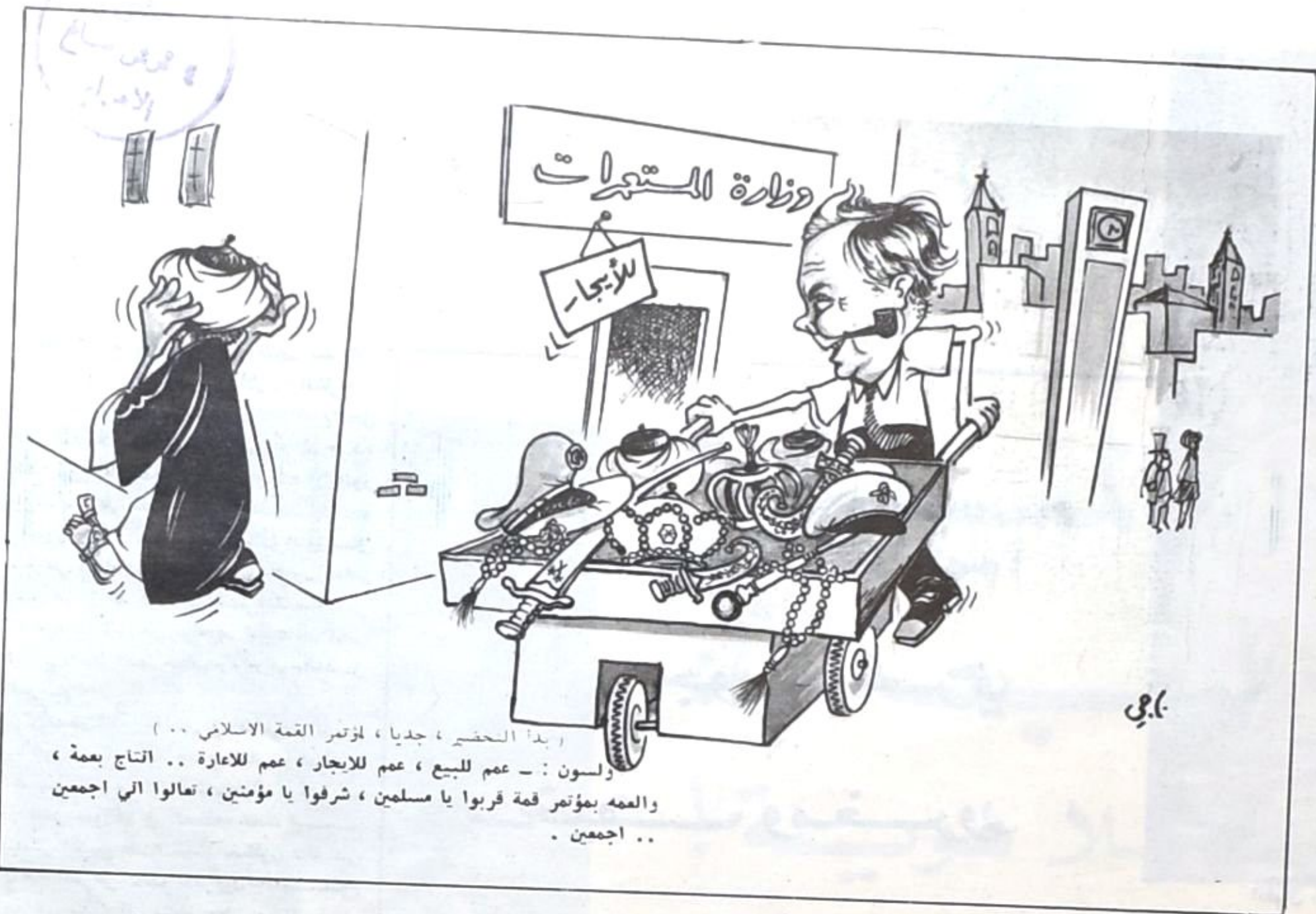
يبدأ الحصر ، جديا ، لمؤتمر القمة الاسلامي .. لسون : - عم للبيع ، عم للايجار ، عم للاعارة .. انتاج بعمه ، والعمه بمؤتمر قمة قربوا يا مسلمين ، شرفوا يا مؤمنين ، تعالوا الي اجمعين .. اجمعين .

... ام ان « السورم » العربي مختلف ، ومطلوب ، ومتنظر .. من خلال منطلق : لا بل اصحاب الورم في الراس الا اشباهه !! او منطلق : من جاء بالورم يذهب ... او منطلق : ورم بوم والبادي الظم !! وانتظروا معنا ، وترقبوا ، اخبار « الورم » العربي الفريد والبارد !! طه س .