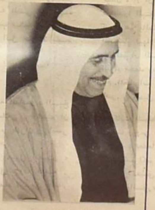
صباح السالم الصباح

لم تكن وساطة الكويت الأخيرة بين السعودية والمملكة المتحدة - كما خيل للمراقبين أول الأمر - مجرد مبادرة تقليدية شبيهة بأسبقاتها من المحاولات الكلامية التي تصدت لها دول «الحياة العربي» بحثاً عن مخرج للصراع الدائر في اليمن ومن حولها. بل إن الدوائر العربية تقول: حقيقة تقوم بها الكويت وأنه لا يمكن النظر إليها كشيء عابر، فلها أثمر نتائج هامة قد تكون لها آثار بعيدة على مستقبل القضية اليمنية.