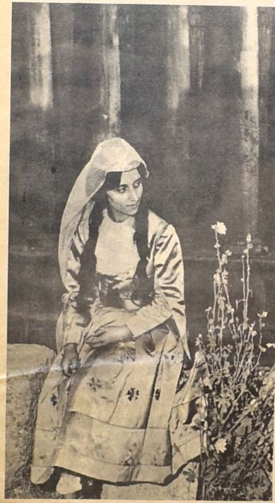
فيروز وايام فخر الدين

وليس من جدال في ان اهم مقومات النجاح في هذه المسرحيات الغنائية، يعود الى ان موضوعاتها تتبع مباشرة من صميم الشعب اللبناني، الريف وخواطر الريف ومشاكله، وازماده الفلكلورية الغنائية، ويرجع ايضا الى ان الذين يقومون بتأدية الاغاني في هذه المسرحيات اناس من ذوي المواهب، اناس عندهم التجارب الذاتية اصلا عن الموضوعات التي يقدمونها الفسيفساء، والفلكلور.