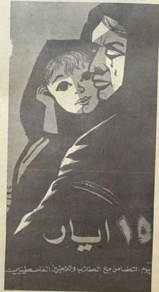
يوم التضامن مع الطلاب والناشطين الفلسطينيين

الفريقية، ودفعته في مرعته مع « اتحاد الطلاب العالمي » لربح الحركة الطلابية العالمية التي كانت معظمها ما يزال انذاك خارج كلا التجمين سو شعار « الطلاب كطالب فقط . » الموقف من حركة التحرير الوطنية ان هذا الشعار « الطلاب كطالب فقط » الذي يبدو ان برينا تقابيا في ظاهره ، كان يخفي في الحقيقة في ثناياه موقف الحركة الطلابية الفريقية بشكل عام من حركة التحرير والاستعمار القديم بعد انحراب الفريقية الثانية. فقد اتخذت اتحادات طلاب أوروبا الفريقية والولايات المتحدة من حركة التحرير الوطنية ونورانيا موقفا سلبيا او معاديا بفسره عاملان: اولاً كون هذه الحركة الوطنية متوجهة مباشرة ضد دول قسم كبير من هذه الاتحادات ذاتها باعتبارها الدول التي كانت - وما زالت بشكل او باخر - هي ابدول المستعمرة لافريقيا واسيا وأمريكا اللاتينية وثانياً كون قيادات حركة التحرير الوطنية العالمية في مناطق معينة - كفيثام وكوريا متغ - شيوعية . الامر الذي جعل بعض الاتحادات الغربية الأخرى تخط بين الشيوعية وحركة التحرير الوطنية العالمية، ونفذ في حمى صراعات انحراب الباردة موقفا سلبيا من حركة انحراب الطلبة بأكملها .