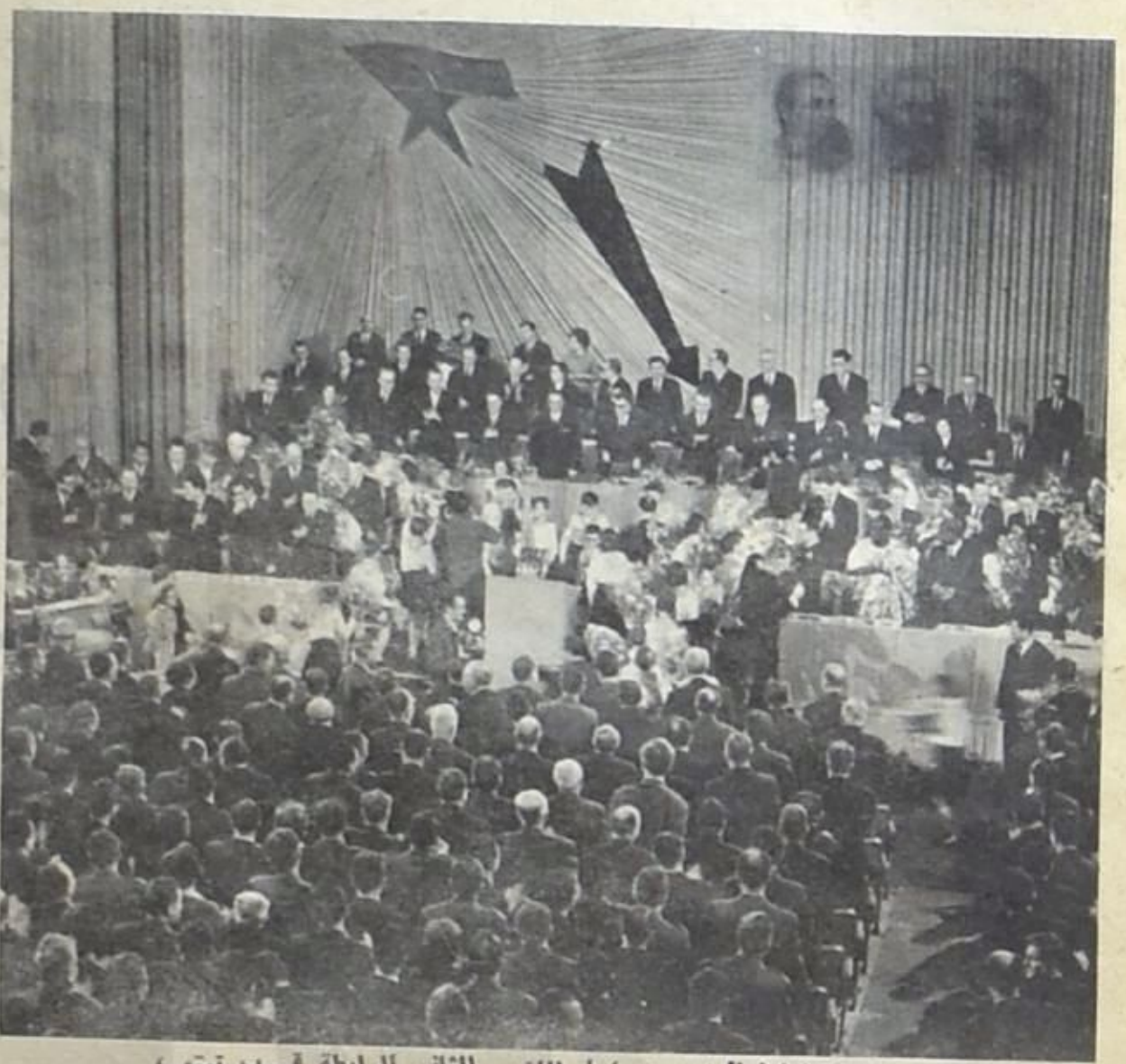
راتكوفيتش (مشارا اليه بسهم) في المؤتمر الثاني للرابطة قرب تيتو.