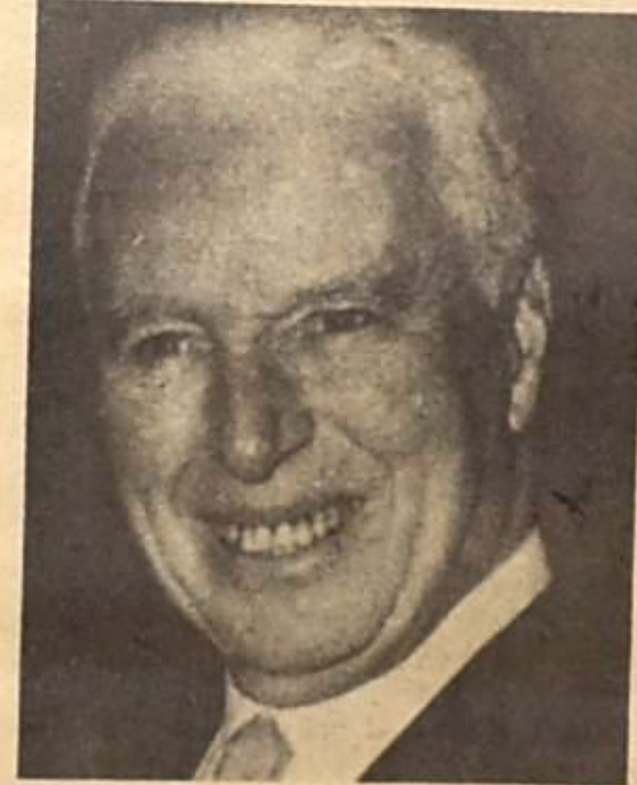
شارلي شابلن والجمهور

الحركة المسرحية التي بدأت عندما، مثل كل النشاطات الفنية الأخرى، مازحة وغير مسؤولة، لا تزال بعد ست سنوات من بدنها مازحة، غير ملتزمة بنهاية أو بهدف، هذا بالرغم من الفرق الفنية التمثيلية التي تشكلت وعملت خلال هذا الوقت، وبالرغم من أن بعض المسرحيات التي قدمت، نجحت نجاحاً نسبياً، يدفع احد ما الى التفاؤل. ان عدم ظهور مسرح لبناني ناجح، بعد ست سنوات من التجربة، والعمل، لا يمكننا أن نلوم عليه المخرج المسرحي وحده، او الممثل المسرحي وحده، فهناك عدة عبات موجودة في طبيعة الجمهور اللبناني، ولا تساعد بشكل او باخر على ايجاد المسرح المطلوب.