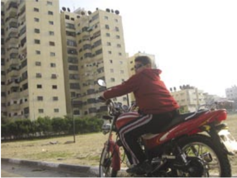
أحد الفتيان في شوارع غزة.