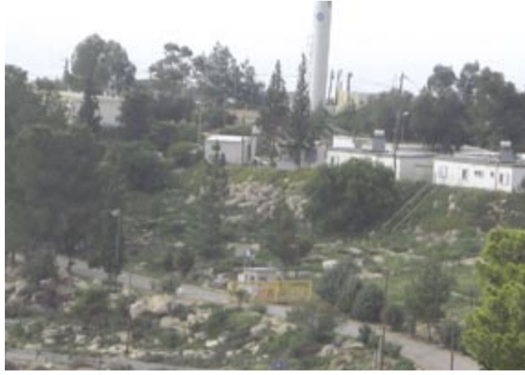
«نيجاهوت» المقامة على أراضي الخربتين.

يجلسون على مقدمة السيارة وعندما طالبهم بالنزول قاموا بتصويرهم.