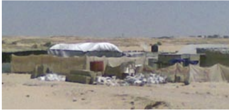
مبان غير قانونية بنيت في «المحمرات» بغزة.

والمتجول في المناطق المحررة، يلحظ قيام عدد من المواطنين بتسوير مساحات من الأراضي والبناء فيها وزراعتها لفرض أمر واقع، ورغم هدم الحكومة تلك المباني والأسوار كما حدث في منطقة البراهمة برفح، إلا أن المواطنين أعادوا تسويرها وزراعتها والبناء فيها ولو غرفة واحدة، فجَزء منهم اشترى تلك الأراضي بأسعار زهيدة من "أعداء الملكية" لعدم مقدرتهم على شراء أرض تؤويهم وأسرهم في ظل ارتفاع