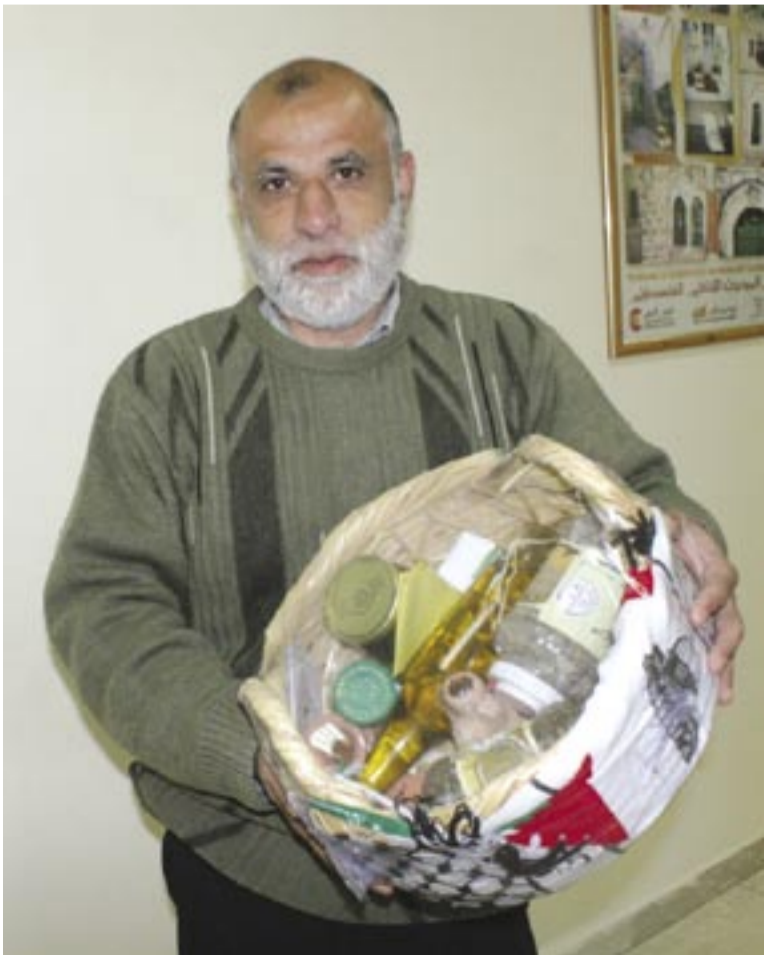
القبلاي يعرض سلته.

موضحاً أن السلة الواحدة بيعت بأربعين دولاراً. ويوضح الأقرع أن هذه المنتجات التي يتم تصديرها لدعم صغار المزارعين وتشجيع التسويق في الخارج، حاصلة على شهادة الجودة الفلسطينية وتحمل شعار وموافقة مؤسسة المواصفات والمقاييس، بما يضمن تصدير بضاعة فلسطينية إلى الأسواق العربية والدولية تُشرف اسم فلسطين.