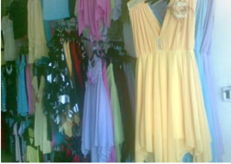
الموضة التركية في أحد محلات غزة.

يلبسه المذيعون والمذيعات على المشاهد في المجتمعات المختلفة وبدا هذا واضحا في الأونة الأخيرة حيث تقوم الفضائيات العربية بثث العديد من المسلسلات التركية على المجتمع العربي، والمجتمع الفلسطيني ليس استثناء من ذلك، فهو مجتمع استهلاكي، وقد بدأت العديد من الأزياء التركية تأخذ طريقها إلى المجتمع الفلسطيني، فمعظم الملابس التي يرتديها طلاب الجامعات الإناث منهم أو الذكور تأخذ الطابع التركي.