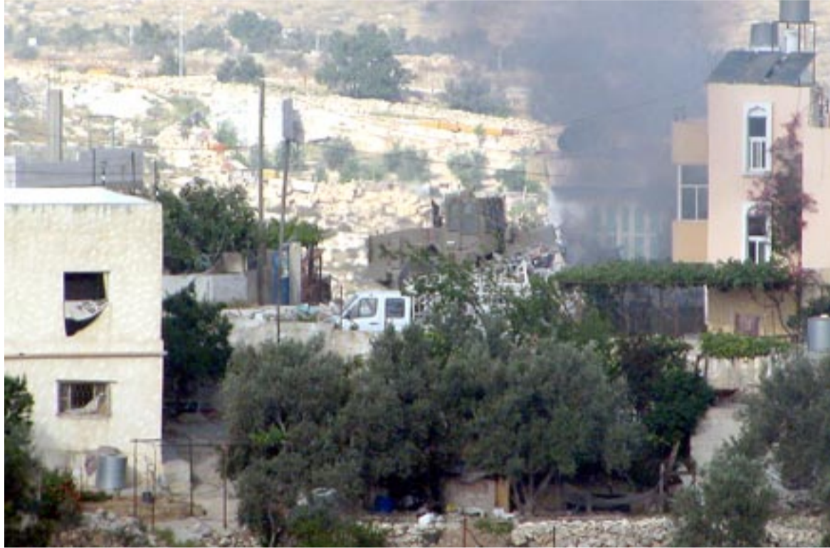
منزل الشهيد السويطي الذي تم تدميره فوق رأسه.

العسكري، موضحاً أن تصرفات الجنود في أكثر من مناسبة تعكس أيضاً ضعف هذا الجيش في الأداء الميداني.