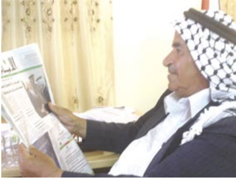
مواطن يتصفح جريدة «الأيام».

جدير بالذكر أن يوم الصحافة العالمي الذي يصادف في الثالث من مايو من كل عام، أكد على ضرورة أن تلتزم الحكومات بحرية الصحافة، ولكن قد لا ينطبق هذا الحديث على الوضع في فلسطين لأسباب أهمها الاحتلال والانقسام، فهناك صحيفة يومية واحدة في غزة تعبر عن رأي حركة حماس، ويعزف كثير من خصومها السياسيين عن مطالعتها لأنها تتبنى وجهة نظر واحدة، كما أن حكومة د. سلام فياض تمنع الصحف الممولة لحركة حماس من التوزيع في الضفة. فإلى متى سيستمر هذا الوضع؟