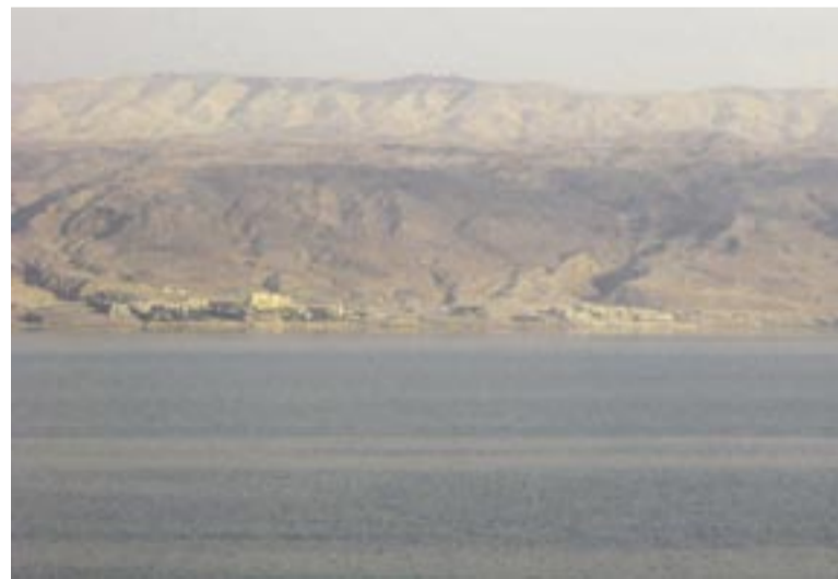
مياه البحر الميت تتناقص بشكل مطرد.