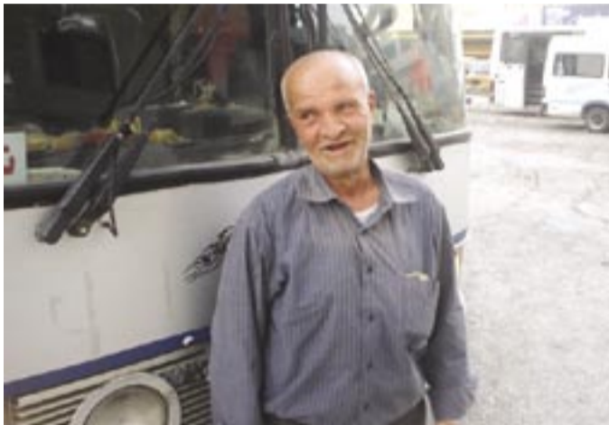
ذيب في مجمع الكراجات.

والشخشير والطيب والاتحاد)، ومع سائقين كثير.. ومعظم الشوفيرية ماتوا، والعابشين كبروا وتركوا الشغل، وتبدلت باصات كثيرة، وتغيرت الأجرة أكثر من مرة..