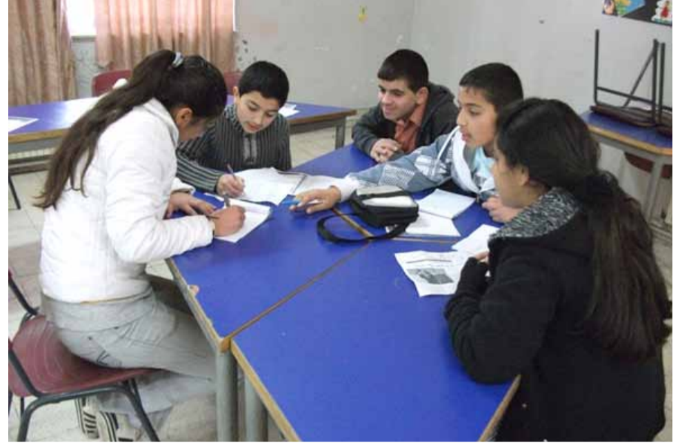
أطفال الإعلام البيئي يسجلون ملاحظاتهم ويغذون مدوناتهم بأخبار البيئة.

شؤون البيئة وهمومها من مساحاتها وفضائها المتعددة بشكل كبير. ويتابع: لو تعامل الإعلاميون في فلسطين مع البيئة على أنها «كلمات متقاطعة» أو «أبراج حظ» لتغير وعينا بقضايا خطيرة نعيشها كل يوم.