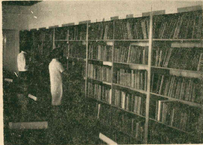
بعض طلاب الكلية وهم يقومون باستعمال المراجع الجديدة في ابحاثهم

لم تستطع ادارة الكلية حتى الان ان تتخلي عن دورها الكلاسيكي في الاشراف التام على نشاطات الطلبة البقية اعلى الصفحة الثانية