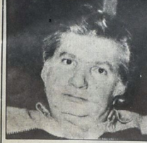
نوتاهارا، ما قيمة أثر حضارة بدون الإنسان

المستعرب اليباني «نوبولجي نوتاهارا» المهتم بالأدب العربي - الذي ترجم خمس قصص لكنفاني إلى اليابانية، يقوم حالياً بزيارة للقطر العربي السوري، بهدف الاطلاع على النشاط الأدبي فيه ودراسة حياة البدو في صحرائه ..