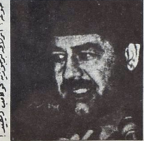
مباركة، الزعيم الجوهري للثورة الفلسطينية