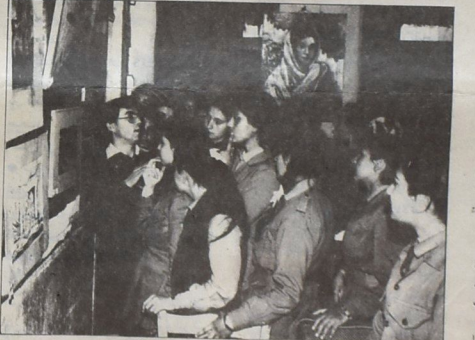
حاصل من الحضور اثناء احتفال المعرّن

ووطننا من هذا الكيان الغريب الذي تحاول قوى الاستعمار الصهيونية فرضه على هذه الأمة . وأضاف : من هنا نقفما رفعا راية الاعتراض ورفعا ينادفنا أمام المحرّفين الذين حاولوا ان يحرقوا الثورة عن سمارها نحن بذلك نركز الى كل الماض الضالّي لشعبنا وامتنا العربية التي جاهدت كل الغزوات على مر