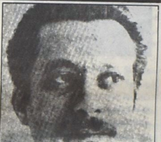
عبد السلام العجيلي، «زواج ديدو وفلاحون»