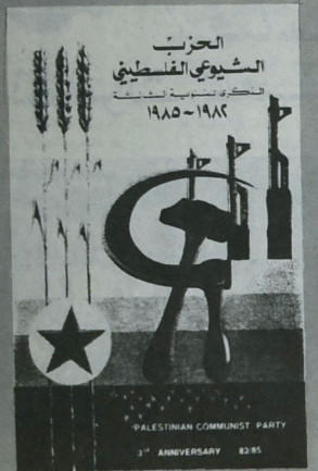
الحزب الشيوعي الفلسطيني ١٩٨٥-١٩٨٢

القيادة المؤقتة للحزب الشيوعي الفلسطيني ١٩٨٥/٣/٢٧