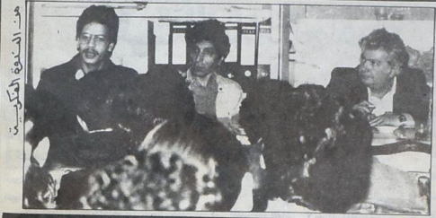
في أسبوع الثقافة الفلسطينية