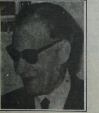
طه حسين، الجمع وشي الخبز

ولا عني أن كلام المميز المعرفي خلال أكثر من قرن غير موجود كعقيدة وإنما أحاول أن أقرب فثلاً ثقافياً وسياسياً مشروع نهوضي لم يكن مؤسساً على معرفة دقيقة وشاملة باليوم، فما كان هاربا إلى أمام... أيقنا نصف الواقع على غير مبرراته المزعومة «أبو القاسم الشابي» بحيث أصبحت صيغته المعنوية معروفة مشروخة يرددها كافة المهزومين... وربما كانت القاسم المشترك الأرحب بين كل القوي الأموية كشعار شامل يؤكد بقضية وأهمية وحمية ميكانكية أكثر رعباً: إن هذا الخليل عابر وإن هذا القديس العطب وإن غداً لناظره قريب وأبوكم له يرعاه!