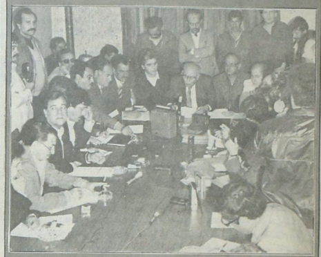
وقبما يلي نص الأسئلة والأجوبة

للمواجهة هذا الغرض الصهيوني الذي يحتل أرضنا ونحن نعلم الجبهة من هنا من خط المقاومة الحقيقية من العدو الصهيوني ولا نعلمنا من تونس أو من عمان