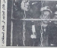
العمال في بلاد المناجم في إقليم اسكتلندا

الاضرابات على نطاق واسع .. وقد تعاون البوليس مع القضاة في المحاكم الاولى ولجا الالويين قوامها اكثر من ادمام الصيف الماضي لمراقبة عدد ضليل من محطمي الاضراب في يوركشاير .. وفي اسبوتفوت وحده ٢٠٠ من رجال البوليس ووضعا في احدى المصانع والمطابخ التي ترتكز كلها لها منذ