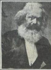
كارل ماركس - من تفسير العالم - إلى تغييره

.. ما دام الأمر يتصل ب«ثقافات» سائدة تركز المفهوم القلبي المتفلسف شعار «أنا وأخي على ابن عمي... وأنا وابن عمي بالعربيع». واليوب من وجع الرأس بتخديد صفة مطلقة لهذا الغريب المعلوم الذي يعني «الغير» لا أكثر ولا أقل، وما دامت هكذا ثقافة تعكس سلطة مؤسسات وعرق تعصب ووفرة احتكاك حاضرة وفالنه على تحليلات أحادية الجانب، باستنتاجات تنطق دائماً وأبداً «نحن» «الغفمة».. جامعة ما