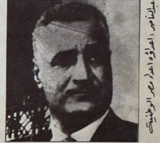
عبدالله صالح، أحد زعماء الثورة الفلسطينية

الإسرائيلية الجديدة ويعزز تضامن المقاومة الفلسطينية مع الحركة الوطنية اللبنانية باتجاه تصليب المقاومة الوطنية اللبنانية والفلسطينية المسلحة والسياسية نهجا آخر يقول بوضوح من قبل اليمن « أنه بدون مصر، لا يمكننا خوض معارك عسكرية حاسمة حيث كانت مصر دائما مفتاح الحرب ضد « إسرائيل »، وهي مفتاح السلام أيضا ». أما اليسار الانتهازي فقد عد بشكل غير مباشر للوصل إلى النتيجة ذاتها بقومية من ميزان القوى الجديد في المنطقة وعن المزاج السياسي السلمي وعن « القومية » في العمل الوطني.