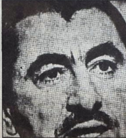
مباركة، الزعيم الجوهري للثورة الفلسطينية

هذا الطرح السياسي أدى بالضرورة إلى ازدياد عمالة الاسترخاء النظري والسياسي والتضالي في المقاومة الفلسطينية وقد انحصرت على طريق تشجيع الحوار مع المباحث مع الإرياقات المتعددة الأمريكية حيث طرح السادات في مباحثات كامب ديفيد أسئلة حاسمة مع « إسرائيل »، وضرورة الأخذ بنظر الاعتبار المعادلة الجديدة لميزان القوى ولبرنامج السياسي الدولي والاقليمي الذي أشاعه اتفاقية كامب ديفيد أو « العهد نحو السلام ». ويستكمل هذا التقليد من المنهج السياسي يقول إن مصر التي انتصرت للحرب عام ١٩٧٣، كان العرب يقبلون دائما خلفها إذا كانت ويترقبون عن العرب إذا توقفت، في ذاتها التي تنصت بالسلام، ويكتفون الإذاعة من توجهها السلمي. ولكن يكمن أحد يعجز عن إعلان ذلك صراحة، بل كان الحديث يدور حول استحالة الحرب بدون مصر. وقد فرق ذلك فعلا المناخ التمس بالإضافة لقرار المجلس الفلسطيني السياسي بالاستعانة من الجنوب وترك سكان المخيمات يبادعون عن أنفسهم ببشاشا، من يقن من العقول يفتي نداء الوجدان الوطني، وتتمنى ذلك بوضوح ضرورة الإبقاء من إمكانية مصر في السلم كما استغنى من إمكانية في الحرب، فمصر مفتاح الحرب وفتح السلم !