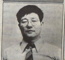
نوتاهارا، ما قيمة أثر حضارة بدون الإنسان

● لقد حدثنا عن الانسحاب الياباني وانضمامك الشخصية بأدب العربي .. ● العلاقات الثقافية بين اليابان والبلاد العربية كانت ضعيفة، لأنه يمكن تصنيفها سواء كدول محيطية بالنسبة للمركز الأوروبي، وكان أطراف المحيط تحاول أن تطور علاقاتها بالمركز، بينما تدعم العلاقات بين دول الأطراف .. وهذا يكون في أوضح صورة بالنسبة للثقافة .. ● لماذا حدثنا عن الانسحاب الياباني وانضمامك الشخصية بأدب العربي .. ● العلاقات الثقافية بين اليابان والبلاد العربية كانت ضعيفة، لأنه يمكن تصنيفها سواء كدول محيطية بالنسبة للمركز الأوروبي، وكان أطراف المحيط تحاول أن تطور علاقاتها بالمركز، بينما تدعم العلاقات بين دول الأطراف .. وهذا يكون في أوضح صورة بالنسبة للثقافة ..