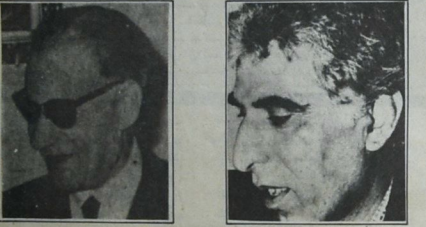
طه حسين، الجمع وشي الخبز

عن الثاني والموضوعي لغرض واحد هو شوبه الحقيقية. وما دامت الصورة مشوهة والخصائص عديدة ومتمايزة.. فإن الكتابة عن ثقافة لشخص معين تصبح وسط «عقري» عبارات شائكة التي جحد التأسيس القروي لصالح كل ما هو مستور وخبث. إن مفهوم Massoud اختراع هنري معروف، إلا انه شائع ومستند بأسماء أخرى وسط الشلل الثقافية المعينة بمواقف سياسية لكافة الأحزاب والشرائط