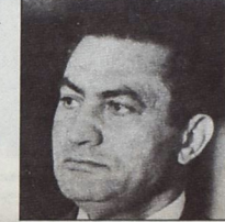
هيلم، دور ماركس في الثورة