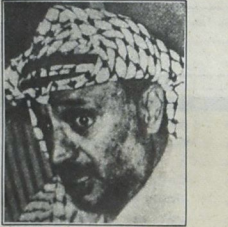
عرفت وإعلامه، الغزالي ضد العرب