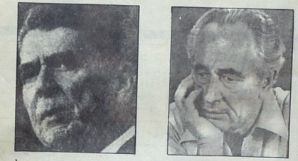
بيير . بيان خطة مشتركة لمواجهة المغيرات اللبنانية

في آخر تصريح لقاها اسحاق رابين وزير الحرب الصهيوني عن موقف كيانه من لبنان أكد رابين أن الانسحاب « الاسرائيلي » من لبنان عام يكتمل خلال اسابيع ، وأن هذا الانسحاب لن يعتمد على اتفاقات « أمية » مع اللبنانيين أو السوريين أو القوى الأخرى في لبنان . وذلك في إشارة واضحة إلى القوى التي دأب قادة الكيان الصهيوني بتسميتهم بـ « القوى المحلية » ؛ ولكن رابين أكد في الوقت ذاته انه « لن يكون هناك هدوء من طرف واحد . إذ لم نتمكن من العيش في طرقتنا بهدوء فإن الحياة في لبنان لن تكون أمية أيضا » وسوف يتم « استخدام كل القوة والقدرة القتالية التي يمتلكها الجيش الاسرائيلي من تير والبحر والجو » .