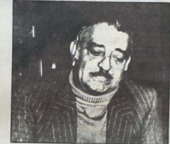
عبد هاستا، زيج - ديدو - وفلاحون