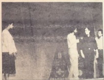
من مسرحية «صبي»