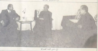
مع رئيس عمدة الصداقة

بشاور بشأنها مع منظمة التحرير والبلدان العربية وعلى المستوى الدولي لاق تشانغ شي ان سياسة الصين هي سياسة الاعتراع والتعايش مع كافة الدول والاطمعة التي تربطها علاقة بصحوة في الصين الشعبية. وصر وفد المكتب السياسي من عربة ان حثبات بافصا بصحوة العلاقات والتشاور مع اجهزة الديمقراطية بشأن القضايا التي تم التفرير. الوطنية والاقامة والدولية