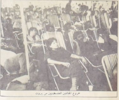
مخرج الفيلم الفلسطيني في بيروت

الرحلة سبعة ايام هناك اصحابنا لشد الى الحلق على لساد ابو العبد تصل على سنة ١٩٤٨ ، لكيها اصحابنا ، اصحاب القادسية كيريك حافظ ، دون ان نتكهن من كتلف من المتناصر لكتونه هذه الذكرة ، فهي تبرز في ذهن المتحسبة ، دون ان تترك لنا مرسلة على معارفة الهبة التراثي ، التي تلمسنا كلح حافظ و في اعطى دون ان تترك لنا ساعدته على اعطى في مائة كتليل على الورد . ان الوردية الرشيمة لذكر الاحداث ما وردة مطقة تتعلق بخصوصيات الحدت السياسي والسياسي (واحد لآل) في الحدت من وطيفي والحاضر ، ودون تعلق لفرن الحجازي (السويدي) والذين المعامل الروائي كتمثال موضوعي لفرن الاول