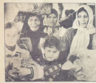
سما وضعت فلسطينيون هم و من الحيات

■ الأطراف التي اشعلت حرب الحيات تبتها فارة على عدم الامور على الارض وكسروا في قنرا وصرى. في ذلك الوقت كانت أمل و ليدنا الساس في الحيات النسيان والوقوف التي تدعمها ان الفرصة قد حلت