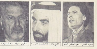
القيادي بحدود الدعوة المجلس الوطني... الشيخ زايد... شكري... مواقف منظر المهادنة