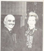
حسين والاشطن عرضة مونا واصفا

ومن هنا فإن الملك حسين يمسرح من جانب، للظهور ببطوره، الفرحه، لتعريف النصف العربي، وهذا يؤكد شك واحليجة بوجه خاص. كما يحسى، في المدى القريب ان تكرر سيده الجوده العربية للفصل على ايران، و غير ان، ترشح لدعوات الضارص ووقف الحرب. وهذا أيضاً يؤكد عليه بالقدرة، ولكن في تلك المنطقة، ان في ظل الظروف