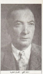
سيد القفي : تصام الحكومة

ولقد الانتفاضة الشجعة ضد حطاف بعدادا ومزاورة احصاع الاردن لحظظة والدفاع والاميرالية على قنرين : الاولى ، وهي التي تشد في ١٥ كانون الاول ، وهو يوم تشكيل كميون حزاع المجلد التي قامت حاملة الانتفاضة ، وبمصر الانتفاضة واصحها القمع من الشعب في الانتفاضة - الى يوم ٢٢ كانون اول ، الى حتى تم اسقاط ولقد الانتفاضة الشجعة ضد حطاف بعدادا ومزاورة احصاع الاردن لحظظة والدفاع والاميرالية على قنرين : الاولى ، وهي التي تشد في ١٥ كانون الاول ، وهو يوم تشكيل كميون حزاع المجلد التي قامت حاملة الانتفاضة ، وبمصر الانتفاضة واصحها القمع من الشعب في الانتفاضة - الى يوم ٢٢ كانون اول ، الى حتى تم اسقاط