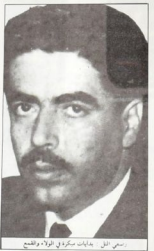
الجنرال مصطفى مصطفى التاجر عام 1967

في تلك تلكا على إثره طلق جيش القوات... في تلك تلكا على إثره طلق جيش القوات