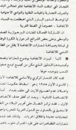
سيد القفي : تصام الحكومة

لقد تعرضت هذه الانتفاضة الجهادية الرافعة حيلة تسوية لطفة من جانب السلطات الحاكمة فقد وصفت باصطخاها و قفة ، وادعات تشد ، و رعا عيطوة ، ورسم التشاركون فيها ، بالبروع للشعب والتدبير ، كما السدارة البريطانية بينا والحزبال حلوب رافعي اعان صنع صلاحة حيد التصاور والتصبرين وتدير و اموال ) السويدية ، وزعم واصحاب القامح من قبل الدواير الاسيادية البريطانية باشاع نطق الكركة الجهادية في الانتفاضة ، وبمصر الانتفاضة واصحها القمع من الشعب في الانتفاضة - الى يوم ٢٢ كانون اول ، الى حتى تم اسقاط