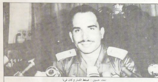
الجنرال مصطفى مصطفى التاجر عام 1967

(١) ولشكته ان الاضطرابات لا يتم التعامل معها بحزم كاف، وتراجع الضعف بعد التملك طاقا... مع مشاركة حلف حوزات الحدود في التصرف الجاهلي... في تلك تلكا على إثره طلق جيش القوات