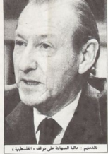
فالدهايم عليه الصلوة على مرثاه - الفلسطينية - الاسم المحدث

يسد على البوليف الحماة والدة - وادوات الاسلامية عليه الحكومة ينادي بموثة لاسلاميات الحزب الذي اتى العلاقات السوفية - الاسرائيلية - فقد حاليهم حزموع - رئيس الدولة الصهيونية من اي