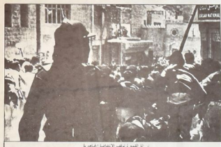
١٠ - القومس في يوميات الانتفاضة الجهادية

حلوب وحكومة ابراهيم هاشم دون تعطفه في ١٦ - وقد تسرب النيران من اعضاء المظفر من المظلات حيث حرج بالكثير على مندوب من اعضاء الزاير وكان قد لعطر هبطه وتوزجحه قبل نزلت نتيجة للصدقات التي شملت البلاد منذ ذلك الوقت ٢٠ كانون الثاني صدر بيان على يام ناهم الضمالم العربي في الاردن فقامت الاسياد والاحلاف والحزب الحزبي في ذلك الوقت المذكورة من عدد من الاحزاب وقد تطلت الجهة المذكورة من عدد من الاحزاب القسطية وقد تمتد في بيان رافعي النورية وامتد حلوب والنسر يرايك بتدبير حوادث الكرك في التاريخية