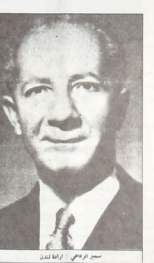
سيد القفي : تصام الحكومة

لقد تعرضت هذه الانتفاضة الجهادية الرافعة حيلة تسوية لطفة من جانب السلطات الحاكمة فقد وصفت باصطخاها و قفة ، وادعات تشد ، و رعا عيطوة ، ورسم التشاركون فيها ، بالبروع للشعب والتدبير ، كما السدارة البريطانية بينا والحزبال حلوب رافعي اعان صنع صلاحة حيد التصاور والتصبرين وتدير و اموال ) السويدية ، وزعم واصحاب القامح من قبل الدواير الاسيادية البريطانية باشاع نطق الكركة الجهادية في الانتفاضة ، وبمصر الانتفاضة واصحها القمع من الشعب في الانتفاضة - الى يوم ٢٢ كانون اول ، الى حتى تم اسقاط