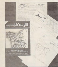
القرشات الأردنية السرية

■ حلال الأسبوع القليلة الماضية ، قبل مدحة البريوق السوية أو بعدها بقليل ، صدرت اعداد عديدة من دوريات كاشمية معروفة لتسارع الوطني وتطهير الفعلية التشريعية في صحفنا اسيرة تحرير و طرب الشعب ؛ و هذه الاخرة هبة تطلق باسم سلطة الشبهة التمييزية في الأردن ؛ و هذه ، و هي مطلع ايام الماضي ، صدرت أيضاً بترتبات طاقماني ، اولهما ، ناد السويال ، التي تصدرةها العبدان الهلالي في شركة القافية الأردنية ، و ثانيها ، العلم و العلم ، من التواجد التشريعية للتمييز بين التعميرين في التنظيم القضائي الوطني ؛ و تضمن كل منهما جوانب ثمانية سوات ، و في اواخر ايار المنصر صدر العدد الخامس من هبة ، الفصح ، و صدرها ، و هذه العجلة عدلت بمؤرخ العام الثالث و اربعون. العجلات والقرشات المذكورة انا عينها بما مرنا بصحتها باعتبارها بوزة تعكس سنوات خلتها وبتوسطه من قضايا الجرائم الجرمية وروحية في الأردن ، وبتصديق لظهور وبتدبير الابدان السياسية والاقتصادية ، الاجمعية المسبقة التي تصطبغ يا لبلاد ، كما تنصت بغير شكالات الارزني وهرموم ابيا باصهار صحفنا في شكلها خلت من حرموم الاردن واهل البرومال التي تشبهني هيفك الايساط الجرمية والاصحافية لتفقدان من اهل حوزن شاملة واطارية في الازمنة التركية ولفهدة تبدأ ، بالفجر ، الثالثة باسم العجلة الثانية الأردنية و رثاء ،