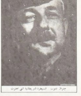
جوزاف صوب - وزير الخارجية البريطانية في العراق

كان لتفدية ميعود الحنجرى الذي وجهه ليل للمسؤولين الاردنيين بصفه مسافر من معارضة وزير آخرو العقري فقد ظن ان غير للاستجابة الى شرطه بالظلمين ، وبانه على ذلك ليل ولساناً في البريطانية كلف مزاج الحلف بتأليف حكومة جديدة . وهكذا قدم حيدم لثلاثة ١٣ بركات اولية استقالة حكومة