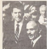
حسين ويمن واشطن فيرستينا

وإذا كان هذا والدموع وفوقه وطوح واشطن أيضاً، والذي لا يغي في الجحور سوى ذلك تعاقب التحريم ويؤكد بديل ماسك في يمسرح في تعقبة قضية الطرف، حسانياها وقلهاها اخاصة. ومن هنا يمكن التمسرح وهو القعمل الأمريكية التي، هو، غير هذا في واشطن يبرز، مع مفرشاتنا الملك حسين في عهد الصعد، والتي يدك وتأييد منتظلاً لا بداية بيهوده الحزينة.