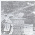
التكتيكية الارض للخطبة . ابتداء لشكنا حديوية في التصل

هدف التكتيكية واحد وهو تخليق شعوريات شعبنا الوطنية وفق الترتيب الوطني الرضلي ، يرتابح الاجماع الفلسطيني باتفاء رواتنا المنظمة والجمعيا القدس بعبارة م ت ف . هذه العدة التي يبلدا وحفا في تقرير شعبنا هذه هي اهداف الاحتلالية الاجرية التي جاءت كائتداء لاضغلات شعبنا منذ اول يوم وقع تحت الاحتلال . شعيرات الاحتلالية ، ونعم م ت ف . كتمثل شرعي وحيد لشعبنا ، ولا لا لكل التكتيكية الفلسطينية ، ولا لا لفرعجية الصهيونية . ونعم م ت ف .