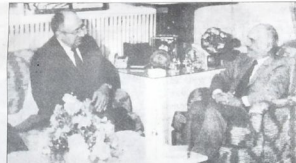
الملك حسين - حبيب - عاون على هذا

في مقابل ذلك وبالصدف من الحركات الرجعية - الأميركية - الإسرائيلية المحتلة . تتواصل الانتفاضة وتتصاعد ، وتسيطر بمراسم حادثة من الأرض -