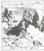
حرب الخليج الذي أعلنه العراق، دور من صير... باليد