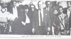
مجموعة من ارباب ائمة - حاشدة جزم الاحتلال ياجين الثورة

السياسي والقوانين الصرية والارامية، والادامر المبكوة. الحزبات الباطنية التي يدع الكثير من ريعها لثمة اسرائيل ولا يسيد بها الاراضي المحتلة.