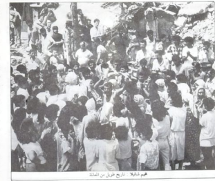
هم تاليف - حريق تلخ من الخطة

وإن يكن النساء وكذلك الأطفال يتحركون ويتحولون دون داخل الخيم أو إلى الخارج بحرية وراحة بسبب