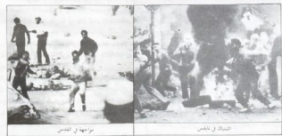
الاحتجاج في القدس

مباركة ثور موحدة ، واليوم السابع واثنين على التوالي ، لتواصل الانتفاضة الفلسطينية الشاملة ، من اجل التراجع مغاليتها الرامية ، في طريق تحرير الاحتلال ، الثورة الشعبية في المناطق المحتلة ، وتوجه نحو مزيد من الاضطراب والوحشية ، هذا ما يؤكده وزير الاحتلال اسحق رابين بعد كل هزلة الاممية للثأر للثأر الامم المتحدة ، الاسابيع الثمانية السابقة ، ان تصعيد على المستوى الوطني الانتفاضة ، ضد عناصر الانتفاضة ، انفس ان تصعد الاممية الشاملة واتساع حدة الاضطراب في وان عشاء الحكومة العسكرية ، والانتفاضة يتخلف جنودها ، يتخيل بعناء الصلوات والشعب الفلسطيني للقيام وصادت الوطنية الموحدة ، مقدرة . ليست غريبة ولا مفاجئة ، في عهدة التي تزعمت على العدوان ، والاضداد على الاسلام والشروط ، وبقوة جيشاً ، لا يهزم ، لا يروق ، بل ويهزمها بحرية التفكير بتقديم تنازل للشعب الفلسطيني ، والقبض ، بدلاً من بحث الطالب ، التي لم تلحق باحسان على ما دعا امريكياً ، عدت الحكومة الاسرائيلية برة اعرض شبح صعدت مشاريع كتاب تيدد السودان ، التي مرتقها حقها الانتفاضة ان حديث الحكومة الاسرائيلية الا ان ، من مشروع الحكم الذاتي ، والادارة المدنية ، وعرضات