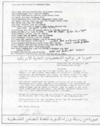
صورة من زيارة وزراء القوية للجنة العصاب الفلسطينية