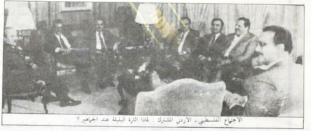
الأجتماع السنوي، الأردني المشترك، هذا المرة الثالثة عند الصفر

■ هناك ما يبرر تلك الزيارة التي قام بها وفد من اللجنة التنفيذية للصنعة الغربية إلى عمان خلال الأيام الأخيرة... ولا يقل ذلك من باب التعجب، على أجزاء... حاد من الحكومة الأردنية، وإنما لأن حوالاً من النوع... حري، في الفترة التي تم فيها، لا يتبقى إلا التبع... سيكونون بالتأكيد مسبقاً للوجود العسكري الأمريكي... الخلف في الخليج، الذي يطرح على أسناد وإعداد حكام... حاليه من دون الخلع، في غير دراماتيكي في جهة... التقليدية بين العراق وإيران، ولكن ذلك ذلك، من... فهم أبناء شبح الخطر عملاً على الخليج، وإضافة هذا... الخطر تامة إلى مركز السيطرة، على مدافع الخلع تعطي... على عمل الحمازة الفلسطينية في الضفة والقطاع، ولعل... عودة الدمام إلى الخليج تشكل خطراً بأكبر مرات أمريكا... تسحب البساط من تحت أقدام الحمازة، والسعي ما... وإذ فتوحاً: بين خيرات واشنطن وإسرائيل وخيرات... حتمل الحمازة الذي قلوا إجماعهم وسقطوا تامة... باليد