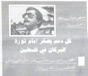
الصادق - في موسكو بتاريخ ٢٠٠٤