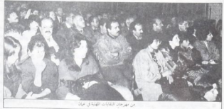
من مهرجان الثبات الهبة في عمان

رسالة عمان : الفلسطينية في التصال لاجاز حقوق الشعب العربي الفلسطيني في تحرير ارضه في العودة وتقرير المصير وإقامة دولة المستقلة بقيادة م . ت . ف كتلة الثوري والوحدة ■ استنكرت الحزب والانتخابات السياسية الوطنية الأردنية مع النشاطات الأردنية فيما تطهران حواممها وراسمة مع التضامنية الاممي الفلسطينية الخلة وضع عولت لتفتيحها والتفتيح على النشاطات التضامنية الحزبية . جاء ذلك في بيان اصدرته قوى الحركة الوطنية الأردنية لعودة الشعب الفلسطيني ، حيث بد نواضل وتصعد الانتفاضة الشاملة واعترابها بحسماً لثورة الثورة