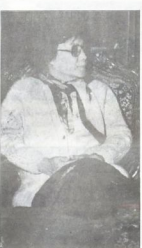
يوسف زوراء كخيتيا، حود من والابراهيمهارة

ويعود في ذلك الثلاث للثلاث تم تنظيم مهرجان آخر يوم ١٨/٨ خصاماً ورمياً لصالح الضمان الفلسطيني في اقطار الحملة بعدد المهرجان المؤلف ثلث لثلاث حراً وشكوكياً وشعبياً. قدموا صيغة التمسك للثمن من الحزب الازرق في حد كبير، وعرض رؤيته وذلك بكونه التمسك الوطني، كما طالب ببدء التمسك الوطني بمرحلة الأمم المتحدة، وبمشاركته مع احزاب الفراع بما في ذلك م ا ت ا التنازلي والوحدة للشعب الفلسطيني. وذكرت القائل تأسيس حزب الضمان الازرق - أسوية، في المؤتمر لفرقة كاد في عطار حوال الضمان الفلسطينية وشكالك تقديم الدعم والتمسان للشعب الفلسطيني. وتأتم عمل كل عاتقا من اجل تقديم الدعم والتمسان للاتفاقيات الفلسطينية. ■ بالنسبة للشكائات ونشاط غننا - مستغف في القيام بنشاطات ومهمات تنظيمية ومستقل كل اخبار اتفاقية الشعب الفلسطيني التي تشرح تفصيلاً العلاقة التي تحسب العاصم، ولكن بعد اسرائيل ان الشعب الفلسطيني يرحم، وما يرافق معه في النشاط والدعم والصدالة ضد الشعب العربي. ■ ايدت اربوع في احد الصبب شكك مند؟ وما ليك مع نتائج هذه الاثنا والي الذي جرى بين