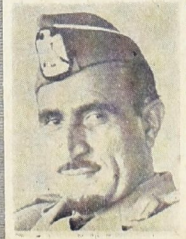
الرئيس عبد الله السلال

تشكلت في الاسوع الفتات الحكومية الجديدة في اليمن، وقد اعلمت هذه الحكومة عن انتهاج سياسة الخرم تجاه كافة بؤر النشاط المهادي المشوهد. وقد جاء تشكيل الحكومة الجديدة في اعقاب سلسلة من النشاطات المشوهدة، في داخل اليمن وخارجها، مما دعا الى الاعلان عن اتخاذ سياسة حازمة في معالفتها للاوضاع الداخلية خاصة بعد ان تعرضت سبله الحل السياسي «لقضية» الذين لصعوبات جديدة. لقد كان من الضر ان عقد مؤتمر وطني جامع لجميع الاطراف اليمنية، لوضع الصيغة النهائية لاتخاذ اركوت. ولكن سلسلة من السوادير المعقدة لطلب المؤيد اخذت تتوالى في الاسابيع الخمسة. وقد استهدفت هذه النشاطات زرع المصائب في طرق القائل السياسي. وبين ان القسوي الرجعية السعودية - التي تتعدى الاستعمارية تقف وراء هذه النشاطات وتداول ابراز «زعمائها» واخر هذه المحاولات التخريبية بعد محاولة الاليزير، تحرك جبهة يمنية من الارض السعودية، بدعمها انها تملك نصيب اليمن، وتطالب ضميا بمعدود التنازل المكني الرضائي. والملاحظ ان جميع محاولات التخريب تركزت حول القضايا التي تشكلت حيزها النظام الجمهوري والقدسية محاولة التشكك بالديموقراطية وتصوير الوضع القميص المنوع السياسي السلاطنت على الديموقراطية. والتمثل على تشويه دور القوات العربية في حياية الثورة.