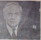
بريسون : افصح اصحرا

مقال التي تسمى كوروش التي تسمى كوروش التي تسمى كوروش التي تسمى كوروش