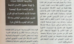
مخاوف البربريل خلال ولاية لولا

بعدما تم تشكيل وإصداره الشعبية الأولى، أصبحت الجبهة الجديدة تحت قيادة البربريل، وذلك في ظل مخاوف من أن الحرب الاقتصادية العالمية قد تؤثر سلباً على الاقتصاد العالمي، مما قد يؤدي إلى تفاقم الأزمة الاقتصادية في البربريل.