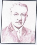
فؤاد الشايب .. الأديب والمناضل