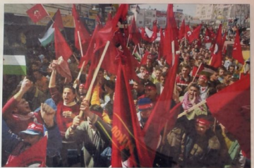
١١ شباط/فبراير ٢٠١٣ على طريق العودة والتحرير (العصير الأملين)

• عاصمت العسكرية الجابية والأرض واللائق للإطاحة الجمدة للجهية الديمقراطية لتحرير فلسطين لهدم المصانع والجنود الشقيدين ■