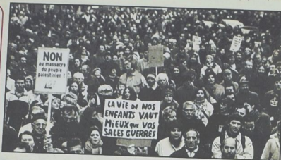
إعلان كتلة ضد الحرب الإسرائيلية على الفلسطينيين والأميركية على العراق، وصرخة من فرنسا، لا للعجز بحق الشعب الفلسطيني، حياة أطفالنا أغلى من حروبكم القذرة