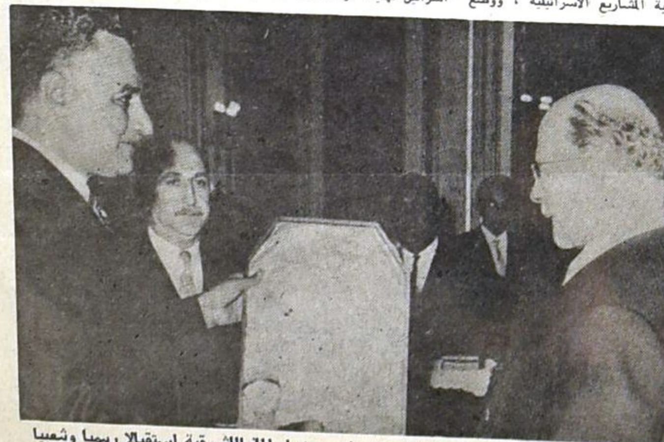
استقبلت القاهرة هذا الاسبوع اولريخت رئيس وزراء المانيا الشرقية استقبالا رسميا وتعبيرا حافلا . وفي الصورة اعلاه الرئيس عبد القاصر يهدي ضيفه ارفع وسام عربي .

ثمن العدد : الكويت ٤٠ فلسا - عدن ثلثان واحد - الاردن ٣٠ فلسا - ليبيا ٣٠ مليما - السودان ٣٠ مليما - العراق ٤٠ فلسا - الخليج العربي نصفاروبية .