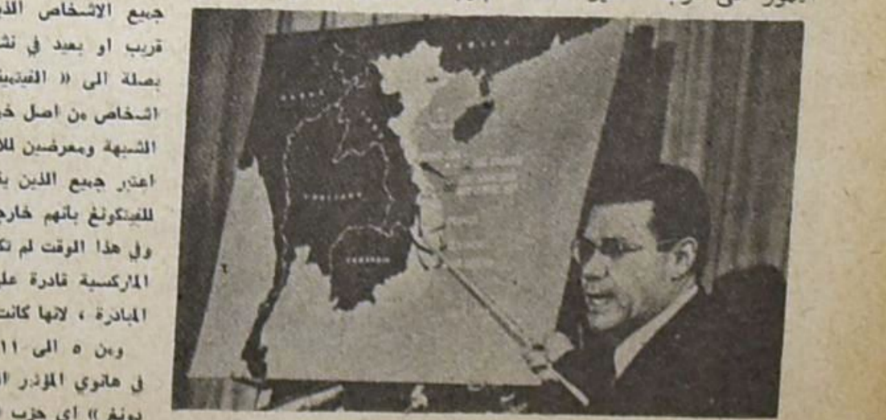
مخطط ماركس الذي فشل !!

وفي عام ١٩٥٩ ، تحول الاتجاه الوحيد لاجراء انتخابات من اجل جعل النظام ديمقراطيا ، حسب طلب واشنطن ، تحول الى هزيمة « فالكنتور دان » فاز في سايفون على المرشح الرسمي ، مما دعا الى ابطال الانتخابات . وعندما شرعت السلطات بحملة حقيقية للملاحقة الفيتكونغ ، اي جميع الأشخاص الذين شاركوا من قرب او بعيد في نشاط منظمة نمت صلة الى « الفيتبينة » . واربعة اشخاص من اصل خمسة اصبحوا تحت المشهية ومعرضين للانتقال . ونشر نص اعتر جيمع الذين يقدرن اية مساعدة للفيتكونغ بانهم خارجون عن القانون . وفي هذا الوقت لم تكن المنظمات الماركسية قادرة على استلام زمام المبادرة ، لانها كانت ملاحقة بشدة . ومن ٥ الى ١١ ايلول ١٩٦٠ عقد في هانوي المؤتمر الثالث لـ « لاو - نغ » اي حزب العمال « الشيوعي » في الشمال .