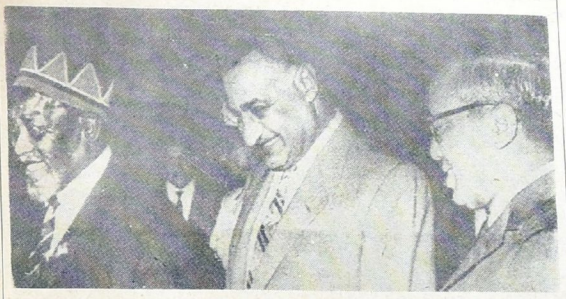
بعقد في القاهرة حاليا مؤتمر رؤساء الدول الافريقية . وفي الصورة يظهر الرئيس عبد الناصر بنوبوط جرمو كينانا ورونات .

ورغم جميع السحب التي تظهر في الاقتر وضع الوصول الى اتفاق فان فرنسا تعمل جاهدة لتضاعف مبركها من جهة والرباط من جهة اخرى على ضرورة ازالة كل عقبة تعترضها لتتوافق . ويهدف باريس من وراء كل هذا الى إيجاد محور اوروفي - افريقي من باريس - مدريد - الرباط - دكار يكون حلقة في سلسلة السياسة المتوقعة الجديدة في بحر المتوسط .