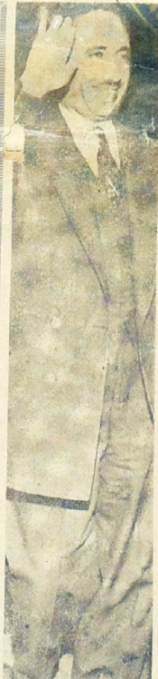
الرئيس عبد السلام عارف

في العرة الواقعة ما بين ١٤ و ١٨ من الشهر الموافق ١٩٦٤ عقد مؤتمر المنظمات والقوى التقدمية في سورية ومؤتمرا فاعلى لثورة ١٨ تشرين في دمشق والخطوات التيمنهجها في تنظيم العمل الوحدوي الاشتراكي العربي باخذ على عاتقه مواصلة النضال لاعداد وحدة الجمهورية العربية المتحدة التي سبها الاتحاد الثامن يوم الثامن والعشرين من ايلول ، ثم طعن الاربعة عشر من ايلول في دمشق . ١ - ان تكون حركة التنظيم الوحدوي الاشتراكي الوجود هو النواة في سوريا للعمل التاريخي الهادف الى ايجاد الازمة الواجبة للثورة العربيةالاشتراكية، والتي يكون كعامة ضد الانفصال الاقليمي ، واتة قضية اخرى في طريق الوحدة ، مساهمة المرحضة في معركة النضال العمري المنهج الاشتراكي الوجودي . ٢ - رفض هذا المؤتمر التامسيوي العربي الذي جاء في اقطاب سلسلة من الاتصالات والخطوات المتضاربة ، - ٣ - ان يكون من حركة القوميين العرب وحركة الوجوديين الاشتراكيين والوجهة التي تتقدم في النضال الوطني والخطوات التيمنهجها في تنظيم العمل الوحدوي الاشتراكي العربي باخذ على عاتقه مواصلة النضال لاعداد وحدة الجمهورية العربية المتحدة التي سبها الاتحاد الثامن يوم الثامن والعشرين من ايلول ، ثم طعن الاربعة عشر من ايلول في دمشق . ٤ - ان تكون حركة التنظيم الوحدوي الاشتراكي الوجود هو النواة في سوريا للعمل التاريخي الهادف الى ايجاد الازمة الواجبة للثورة العربيةالاشتراكية، والتي يكون كعامة ضد الانفصال الاقليمي ، واتة قضية اخرى في طريق الوحدة ، مساهمة المرحضة في معركة النضال العمري المنهج الاشتراكي الوجودي . ٥ - رفض هذا المؤتمر التامسيوي العربي الذي جاء في اقطاب سلسلة من الاتصالات والخطوات المتضاربة ، -