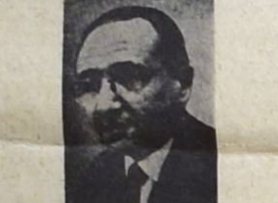
● زرق الله جنادري