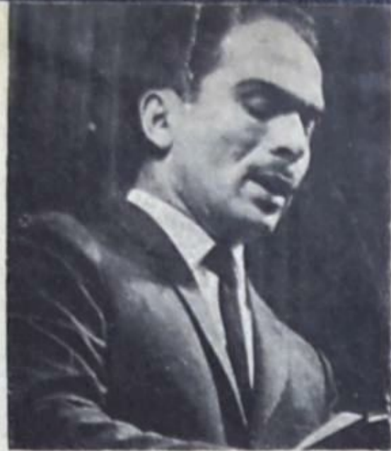
● الملك حسين ●