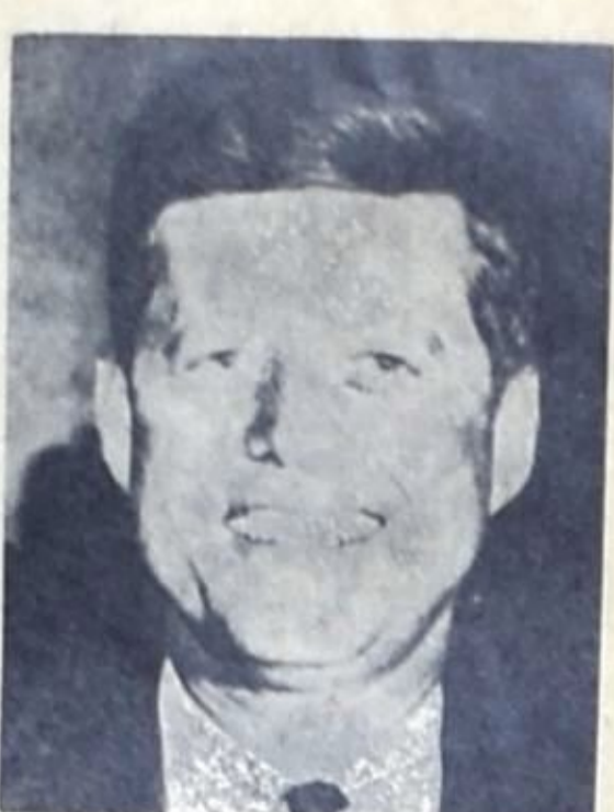
• جون كينيدي •