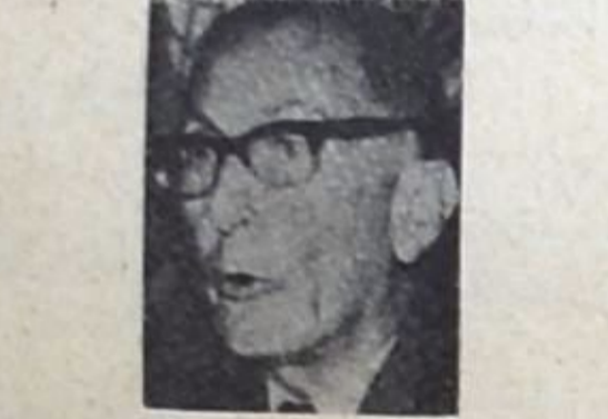
● شوك التلا

● 100 مليون ليرة دفعتها مصرف لبنان في عملية تعويم انترا باريس ، مع امكانية ارتفاع هذا المبلغ الى حد الضعف ، اذا ما وافقت اللجنة المسؤولة عن انترا على تقطص مصرف لبنان المركزي في عمليات تعويم بعض الفروع الاخرى .. ويروج البعض ان دعاية بخسلة تقول ان تعويم باقي الفروع لن يكلف اكثر من 24 مليون ليرة .. وان دفع هذا المبلغ لا يستوجب الكثير من التفكير ، خصوصا على سعة لبنان واقتصاده الحر في العالم !