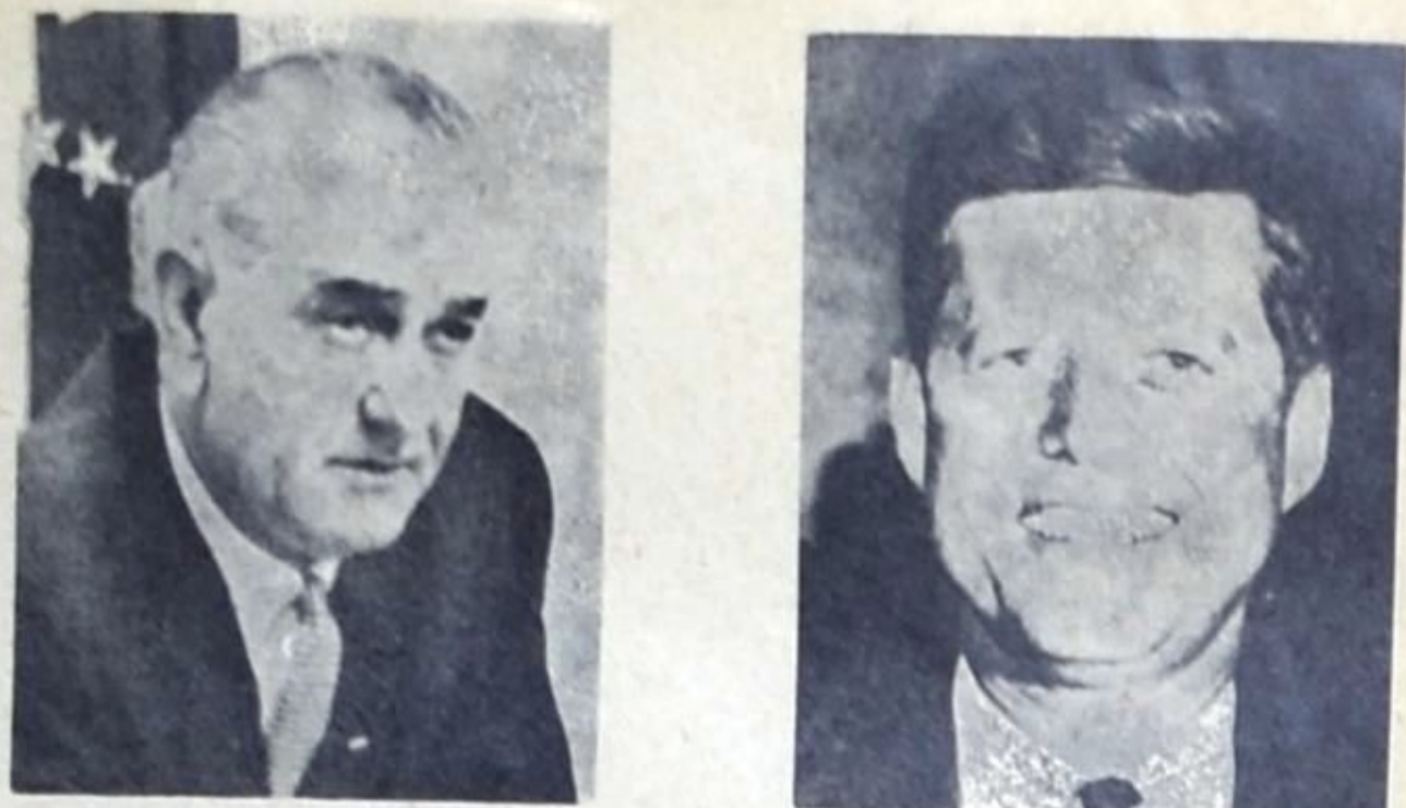
• ليدون جونسون •

ولا يمكن ادراك اعمال هذا المؤتمر وفهمها ، ان لم نضعه في سياقه التاريخي ، وان لم نأخذ بعين الاعتبار وضع المتقنين في الولايات المتحدة . فالحركة الماركسية في اميركا لم تنجح تاريخيا في امتاز جماعات منظمة تعمل في حقل البحث العلمي . فقد تابر ماركس على مراسلة بعض النظريين الاثان المهاجرين الى الولايات المتحدة مثل ويندير وسورج ، ولكن هؤلاء لم يوحدها جهودهم ، ولم يصل نشاطهم الى افاق كبر السيار الأمريكي . وبعد عام ١٩٠٠ ، تدخل بعض المتقنين بصورة اترادية الى الحركة العمالية دون أن يتوصلوا - بدون استثناء - الى لعب دور الملقف الماركسي . وعندما حاولوا أن يقوموا بهذا الدور كانوا يفترضون بشكل شبه دائم ان شركاءهم لديهم تكوين مماثل لتكوينهم ، ولم نفس الاساليب ونفس الاناق . وكان يمكن لطابع البحث الماركسي المنعزل والمحدود في غالب الاحيان ان يخفي وأن يفتخر ابان الامور الكبرى في بداية الثلاثينات التي حدثت بتعبه الاهداف المشتركة وتوزيع المهام والواجبات . ولكن لم يحدث ما كان ينبغي ان يحدث ، هذا مع العلم بان عددا كبيرا من المتقنين انده نحو الماركسية تحت تاثير انديار المحائل المرغفة للراسمالية ، الا أن تكوينهم اليبولوجي اسمح بالسرعة والجزلية . ولم يكن قد تخرج حينذاك سوى جزء يسير من المؤلفات الماركسية الكلاسيكية الأوروبية المعروفة . يضاف الى ذلك ان الاعضاء الجدد كانوا يقضون فترة قصيرة بين صفوف المتقنين الماركسيين ، ثم ان الراسمالية استطاعت ان تقوم اوضاع اقتصادها ، وخفيت على تجمعات اليسار مهيبة عدوانية سهلة ، كما وان الاثار السلبية التي خلفها التنافسية في الاتحاد السوفياني زعمت الشك والاشتباه ومن جهة ثانية ، كف الحزب الشيوعي الذي