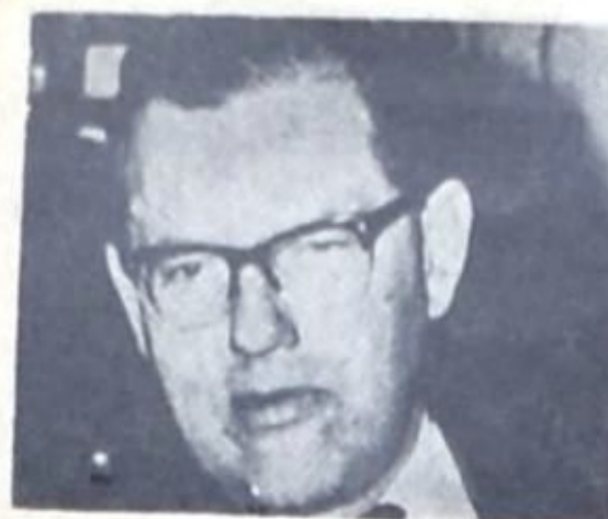
● ابي ايبان ●

أما بالنسبة للاعتبار الثاني ، فإن إسرائيل تحاول أن تتفقد دول السوق بأن الضغط العربي ليس إلا مناورة للضغط لا تخفي خلفها أية نوايا جديدة . ولكنها مع ذلك تبدي بعض التحفظ وتفكر بالدعوة لنوع من التوازن تقبل فيه عضوية إسرائيل كيقابل لعضوية بلد عربي أو أكثر . أن ما يهمها في هذا المجال هو أن تجد الدولة التي تتبنى قبولها ، مثلما تتبنى فرنسا دول الغرب العربي ، وهي تخشى أن يسود ضغط الجامعة الاقتصادية والصناعية المصلحة بانضمامها للسوق . غير أن ما نشرته صحيفة « معارف » بتاريخ ٢٧-١-٧٧ يعكس مشاعر التشاوم واليباس لدى اوساط إسرائيل ، حيال زوج التردد