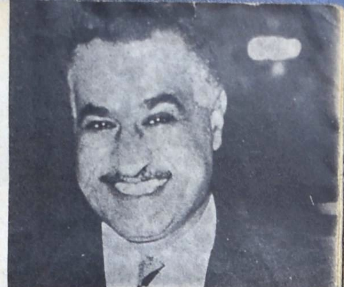
الرئيس جمال عبد الناصر .

ان الوحدة العربية لم تكن - عندما انطلقت الدعوة اليها - مجرد امنية عاطفية نبتت في مخيلة البعض ، بل كانت في الاصل حركة . وهي كحركة ، استندت في قدرتها على الفعل الى جملة حوافز تاريخية جعلتها اضع بكثير من مجرد شعار تلح عليه العواطف ، أو تجربة للوحدة الدستورية تقوم بين بلدين أو أكثر لترسم بتجاربها أو تسهلها معالم المستقبل الوجودي العربي كله . ان حركة الوحدة العربية انطلقت في الاصل تعبيرا عن نزوع التطور العربي المعاصر الى التماثل في مجتمع موحد له من الروابط اللغوية والتاريخية والمادية ما يجعله الاطار القادر وحده على استيعاب مهمات التقدم العربي ونضائها بكل زخمها وشموه نتائجها . . . ولم يكن التطور المعاصر ، الذي انطلقت شراياته منذ مطلع هذا القرن ، الا اعلاسا عن دخول المجتمع العربي في معظم رقعة مرحلة جديدة في مجتمع موحد له من الروابط اللغوية والتاريخية والمادية ما يجعله الاطار القادر وحده على استيعاب مهمات التقدم العربي ونضائها بكل زخمها وشموه نتائجها . . . ولم يكن التطور المعاصر ، الذي انطلقت شراياته منذ مطلع هذا القرن ، الا اعلاسا عن دخول المجتمع العربي في معظم رقعة مرحلة جديدة في مجتمع موحد له من الروابط اللغوية والتاريخية والمادية ما يجعله الاطار القادر وحده على استيعاب مهمات التقدم العربي ونضائها بكل زخمها وشموه نتائجها . . .