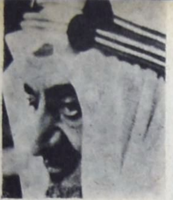
● الملك فيصل ●