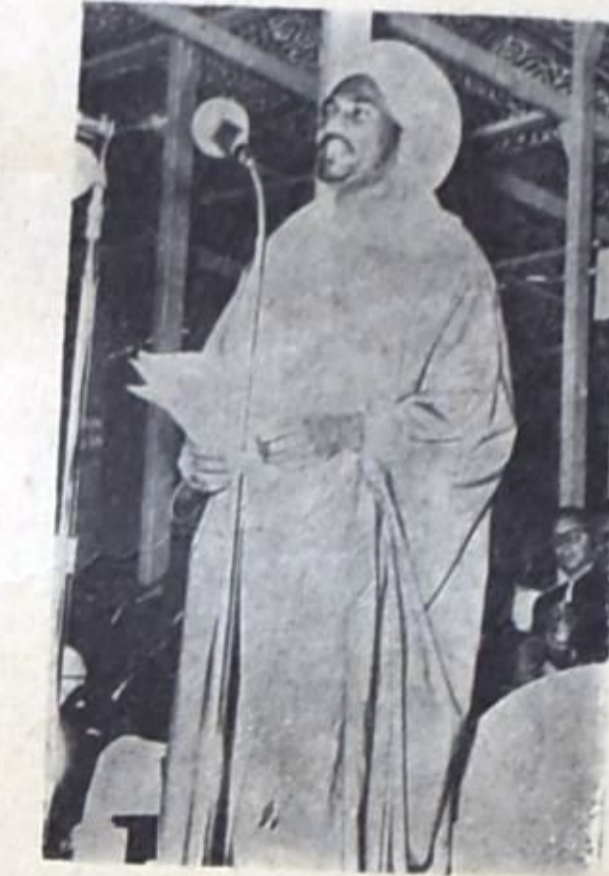
● الصادق المهدي ●