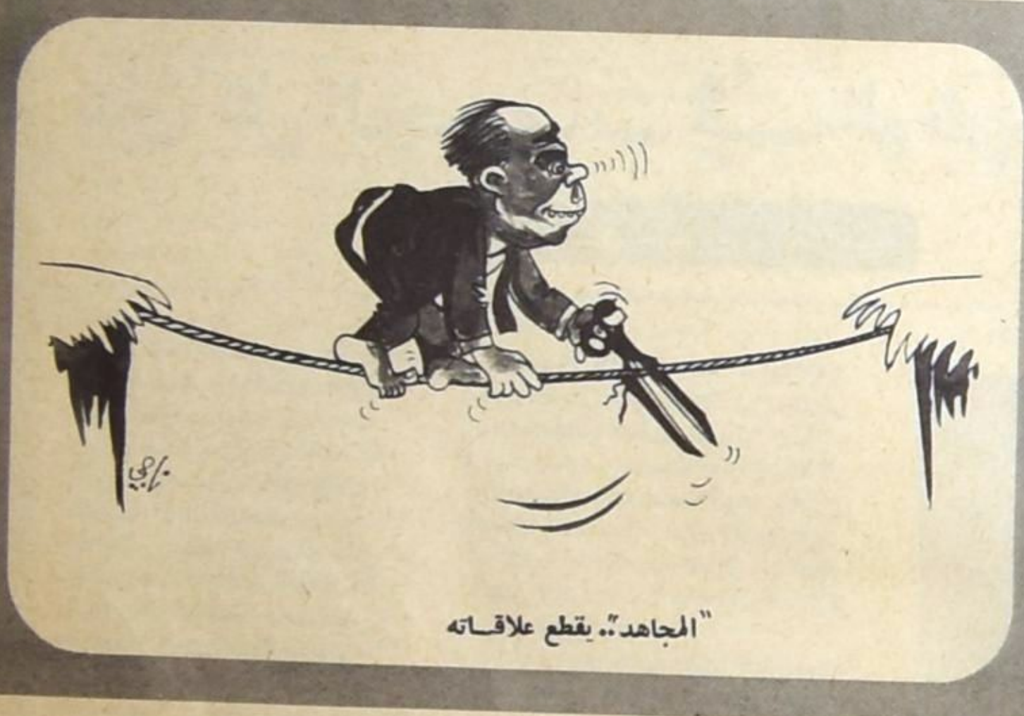
«المجاهد» يقطع علاقاته