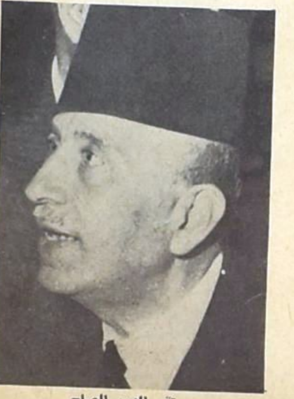
تحي الدين الصلح

المرشح اليافي ان يكون المقصود ياي هجوم ثيابي مقترض ، الا ان التسوية لا بد ان تاتي بالنتيجة على حساب .. ونو انتهى الامر الى حل « الرجل الثالث » نيس الا ..