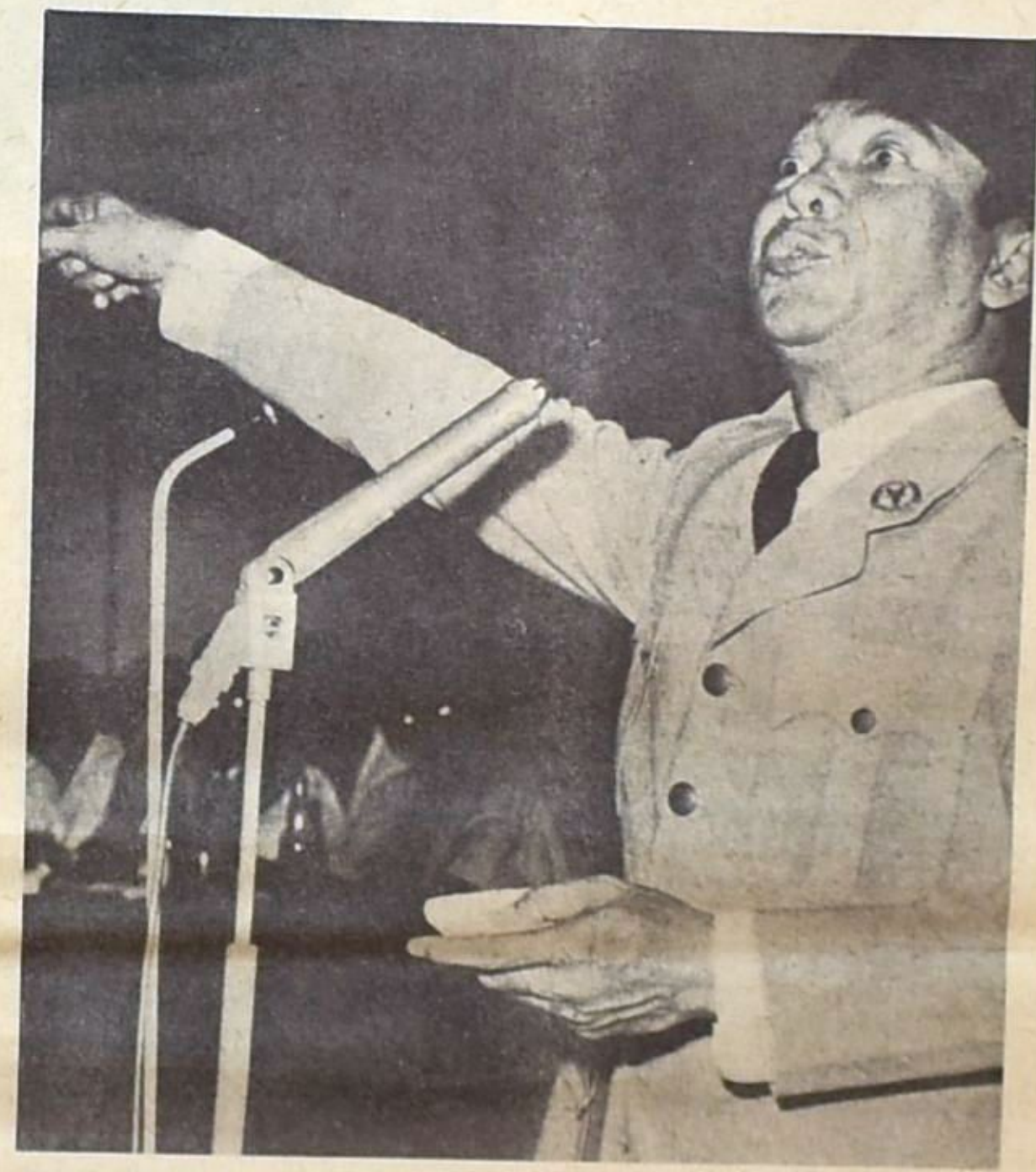
سوكارنو : ارفع شعبي !

تستمر محاكمة وزير الخارجية الاندونيسية السابق الدكتور سوباندريو في ظل محكمة عسكرية خاصة وبهم محددة ومتعددة ، وتظهر تلك المحاكمة بالتالي وكأنها تحاكم اعمالا خارجية وداخلية نفذت في عهد الرئيس الاندونيسي الدكتور سوكارنو ، حتى كأنها تحاكم سوباندريو لتنفيذ اوامر سوكارنو او العكس ، او تحاكم عهد سوكارنو بكامله .