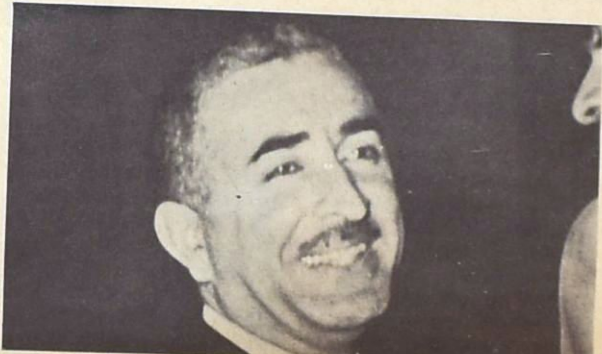
رشيد كرامي : المصالحة المطلوبة ..

بلفت لمة ( ضبط النفس) ذروتها في الأيام القليلة الماضية مع اقتراب أول المواهب الترشية المنتظرة ، والفاصلة في رأي البعض : معركة رئاسة المجلس ، التي ستدور رحاها صباح يوم الثلاثاء المقبل الموافق ١٨ تشرين الأول الجاري . وبقدر ما يحاول الجميع معرفة نوايا الرئيس شارل حلو ومخططاته للمستقبل - إن كانت لديه مخططات جاهزة - فانهم يحاولون عتبا فهم اللعبة من خلال تصرفات عناصرها الأخرى ابتداء برشيد كرامي ونصرحائه القوية أو الوضيعة، وانتهاء بعدالله اليافي الذي يبدو بارعا في تمثيل دور آخر من تعلم !