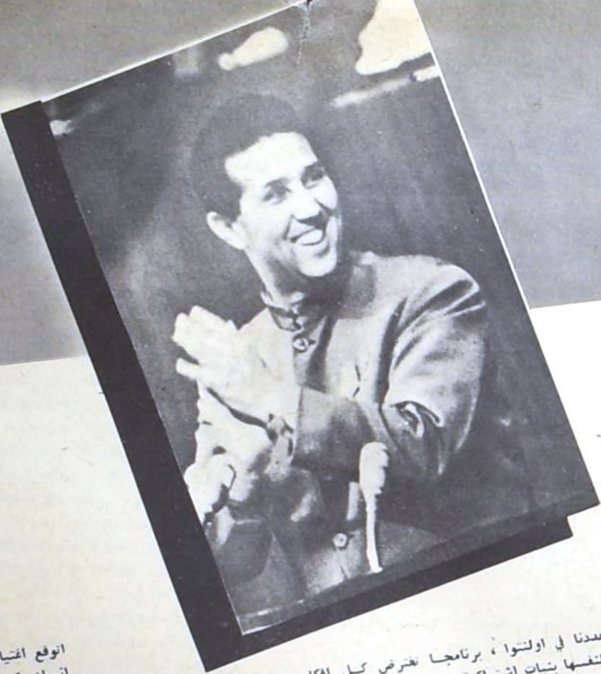
احمد بن بيللا

كما سبق ان ذكرت التحت على الحكومة المؤقتة بان نعد مؤتمرا فور حصولنا على حريتنا . لقد حصل الانسحاب بسيادة الجزائر ولكن هذه السيادة ليست الا شكلا قادرا على احتواء مفاهيم مختلفة . وهذا بالتبسيط ما كان نقطة الضعف في جبهة التحرير مفاهيم مختلفة . وهذا لها لبرنامج ولا مذهب . والثورة الجزائرية كانت ثورة بدون ايدولوجية : وهي الثورة التي سمحت زمن الحرب بايجاد الجميع الواسع ضد القوة الاستعمارية . ولكن بعد عودة السلام اصبحنا فراما خطرا لان انفاليات « ايليان » كان لرواجا من طراز استعماري جديد . وكان لا بد ان مسن التخلص من هذه الزبينة المشوشة التي وجدها بعض اعضاء الحكومة المؤقتة مطمئنة لهم . وكان لا بد من اعطاء الاستقلال مضمونا يدعاهم .