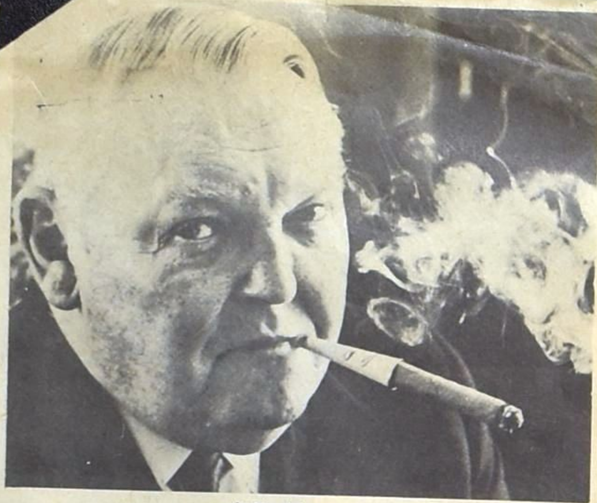
اهرارد ومازق واشتطن .

واير ما جاء في البيان المشترك « ان الرئيس جونسون واهارد ورسولا الى اتفاق مبني حول انشاء خط اتصال مباشر بين