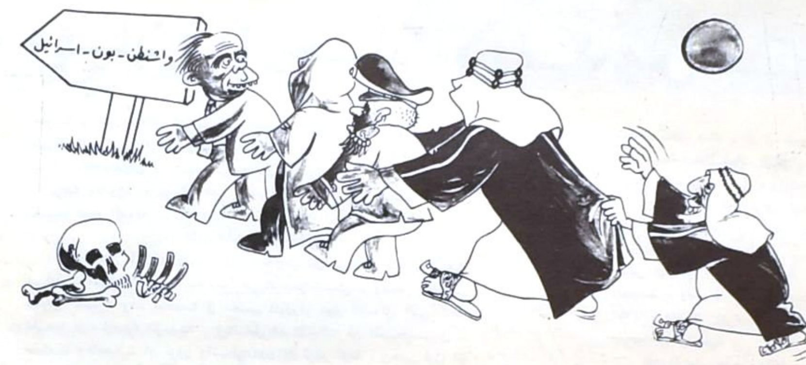
وفق الله خطاكم ، سيروا. ونحن من ورائكم .

قيل ان فيديل كاسترو ، قائد ثورة كوبا ورئيس حكومتها، قد بعث ببرقية الى مدير عام عموم شبكات المخابرات المركزية الاميركية بعد اعلان فشيل رسميا ، بالبرقية التالي نصها : « ادام الله عليكم نعمته الانتقال من « خليج خنازير » الى اخر .. سيروا على بركة الهارين من اوطانهم ولا تياسوا من رحمة الله ، نحن من ورائكم حتى نهاية العالم .. »