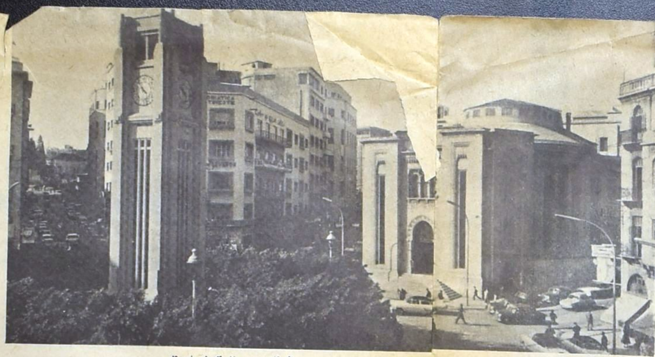
البرلمان : من يمثل النواب فيه !!