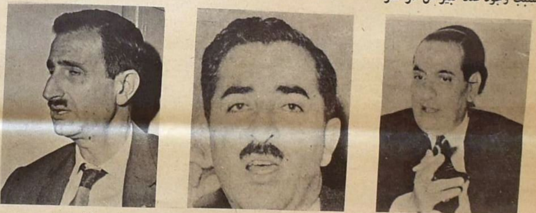
كامل جنبلط رشيد كرامي الرئيس شارل الحلو

اصبح من المؤكد ان الحكومة الحالية سترحل في اواخر شهر آذار الجاري على ايد تقدير ، اي انسر عودة الرئيس كرامي من مؤتمر رؤساء الحكومات العرب . وتسرى الاوساط الرسمية والنيابية ان هذه الحكومة قد انجزت مهمتها ، بانتهاء حركة التطهير التي استمرت منذ منتصف فصل الصيف الماضي . التعيينات الجديدة كما يبدو سترك امر البت بها الحكومة المقبلة ، باعتبارها من الخطوات المقررة التي قد تقوم خلافاً في وجهات النظر حولها الا انها ستفقد بالنتيجة نظراً للضرر الذي يلحق بالادارة العامة بسبب وجود عدد كبير من المراكز الموحدة في ممارسة صلاحياتها والنظر باوضاع الموظفين بناءً على طلب مجلس الوزراء . اما اذا اجرينا مقارنة بسيطة بين ما تشكو منه الادارة من فساد وفسوق ومحسوبية واستغلال ، وبين المعد الهائل من الموظفين العاملين فيها يتبين لنا ان عدد المصروفين لا يشكل سوى جزء يسير من اسباب هذا الفساد المستشري . لكن القانون اللبناني لم يتعد حتى الان على تنفيذ القوانين بطايفه اذ ان جميع القضايا تعالج وصلت اليه . ولا شك بان مجلس الخدمة المدنية وهيئة الفتش المركزي لعبا دوراً هاماً في ضبط شؤون الادارة وتقليص موجة الفساد التي انتشرت بصورة مخيفه خلال العهد الاسبق .