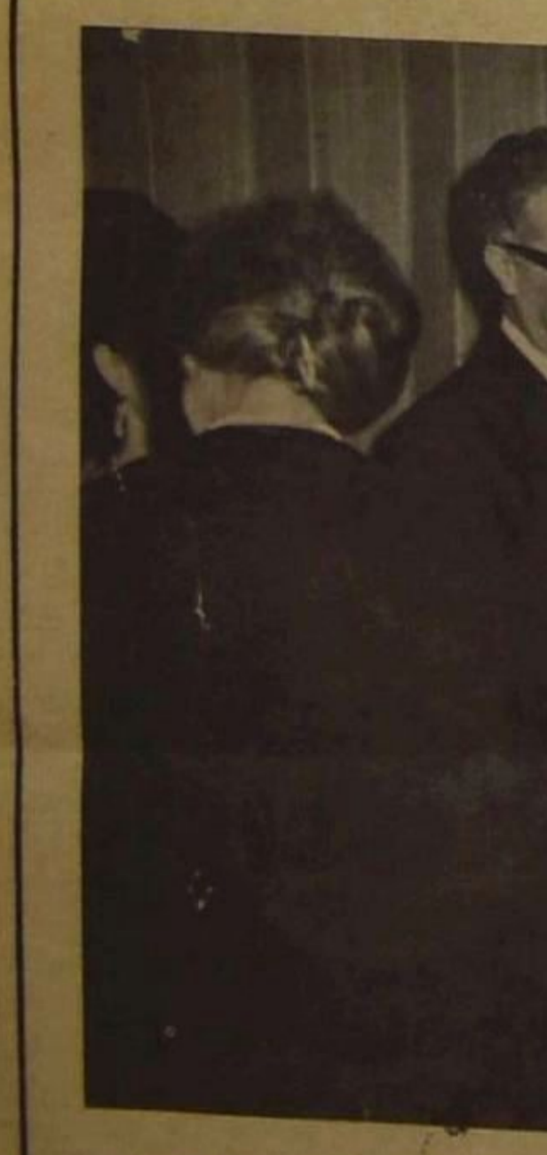
افام السيد هنري بيديس

ان هذا التصريح يضع الحكومة الهندية التي ادت لتورة سكان هضاب ميزو ضد الحكومة المركزية الهندية بشكل عام ، والحكومة المحلية في اسام بشكل خاص . ولكن الى اي مدى يمكن ان يمسزوا المسره للظروف الموضوعية الكامنة في طبيعة الدولة الهندية نشوب التورة ؟ ان الظروف الموضوعية التي هنا هي وجود اقلية دينية او لغوية معيئة ، ذات طموح خاص ، وسطوع لا يتبع لهذه الاقلية تحقيق طموحها . ان سكان هضاب ميزو هم اكثر ثقافة ، واثمج وعيا ، من بقية سكان منطقة اسام . ويعود الفجس في حصولهم على هذا المستوى الثقافي المتقدم نسبيا الى العيشات التبشيرية المسيحية الانكليزية التي عملت وسط صفوفهم منذ فترة طويلة . ان عددا كبيرا من الوجوه البارزة من سكان هضاب ميزو يتكلم نتيجة لذلك اللغة الانكليزية بطلاقة ولكنه يجعل اللغة الاسامية ، الامر الذي عطل قدرته على لعب دور سياسي بارز في منطقة اسام ، التي تشكل مقاطعة ميزو جزءا منها . وامام هذا الطريق المسدود التي وجدت فيه الاقلية المسيحية نفسها ، اخترت التورة على الحكومة الهندية المركزية واعلان الانفصال عن الهند كحل جذري للمشكلة ، وقبل سكان هضاب ميزو ، اختارت اقلية التاجا ، لاسباب مشابهة ، هي ايضا التورة . ان ثورة التاجا ، القاطنين في منطقة مجاورة لهضاب ميزو ، بدأت في عام ١٩٥٥ واستمرت عشر سنوات تقريبا . ولم تتوقف الا قبل ثمانية عشر شهرا ، عندما نجحت الحكومة الهندية في اقناع التاجا بالتفاوض مع الحكومة لاجراء اساس مشترك للتعاون بين الحكومة المركزية