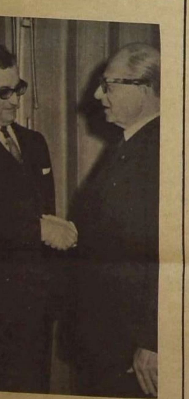
افام السيد هنري بيديس

هو الرد السليم المباشر على مثل هذه الثورات او الاضرابات ، والا شجع سكوت الحكومة كل القبة على محاولة حل مشاكلها باللجوء الى العنف وتهديد سلامة دولة الهند ووحدة ترابها . ولكن الحل الاسلم والاكثر جذري هو في وعي الحكومة الهندية المسبق لمهوسم