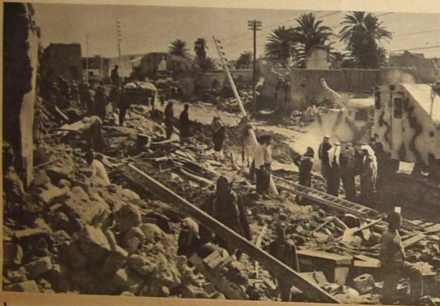
مشهد من مشاهد الدمار الشامل الذي ألم بمدينة معان بالآردين بعد طوفان السيول اريب الذي ألم بها.. يبدو في الصورة الخراب الذي ألم بالسيوت

التحرير الاتولي عبر بلادها. وفي دار السلام أعلن بيان لجبهة التحرير لواتيبيق صدر في الشهر الماضي بان حزام عديدة قد الحقت بالقوات البرتغالية في امان مختلفة من موازيبيق نتيجة لتشاط الجبهة..