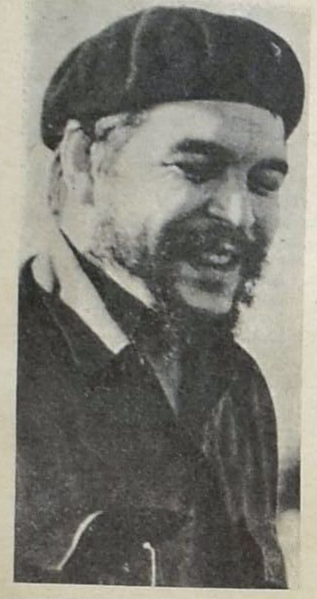
بقلم شي جيفارا

هذه هي رسالة غاية هذا الاجتماع ... وفي هذا الاجتماع بالذات يجب ان لا يكفى فقط بالتصدي للمشاكل الناتجة عن الهيمنة على الاسواق ، ومن تدهور اشكال التبادل وصيفه ، وانما يجب كذلك مواجهة مشكلة من اهم مشاكل هذا العالم ... هي مشكلة كيفية تمسح الأوضاع الاقتصادية الوطنية في البلدان التي تستعمرها بلدان اكثر منها تقدما ، وتستثمر قطاعاتها الاقتصادية الاساسية عن طريق استثماراتها المالية . ونحن مقتنعون - ونقولها بصراحة تامة - بان الحل العادل والوحيد للمشاكل القائمة التي تعاني منها الإنسانية ، هو في الاقواء الكامل للاستقلال الذي تمارسه الدول الرأسمالية في الدول المستعمرة ، وقد جننا الى هنا ونحن نعلم بان المناقشات ستدور بين مثلي الشعوب قمت على جميع اشكال استقلال الانسان للانسان ، وبين مثلي شعوب ما تزال تعتبر ان هذا الاستقلال هو اساس نشاطها وعملها ، هذا بالإضافة الى مثلي مجموعة اكثرية الشعوب التي ما تزال تعاني نتائج الاستقلال . وينبغي علينا ان نناقش من هذا الواقع مباشرة الحوار والمناقشات .