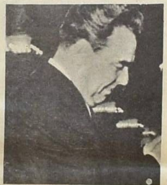
● بريجنيف .. غصن سلام صغير للصين ●

اما الغاء تسمية « مجلس الرئاسة » وهو الهيئة القيادية العليا للحزب والدولة ، واستبدالها بتسمية « المكتب السياسي » ، فقد رأى المرافيون فيه دليلا على رغبة القادة السوفيت الجدد بالتحذر من اية حساسية سياسية ، هو التسمية المطلقة على نفس الهيئة ، واستبدالها بالتسمية الثانية دونما مبرر كاف في رأي القادة الجدد - بعد فترة من موه . واما إعادة منصب « السكرتير العام » ، الذي كان موجودا في عهد لينين ، وشغله ستالين اعتبارا من عام ١٩٢٤ ثم اسقط ذكره بعدا من عام ١٩٢٤ ، فيرى فيه المرافيون رمزا لمحاولات القادة الجدد تأكيد دور الحزب وزيادة رصيده من طريق رد صورته الى صورة ماثلة لوضعها خلال عهد لينين ، مؤسس الحزب والدولة البولشفية . ولا يستطيع المرء ان يجزم فيما اذا كان تحول بريجنيف من « السكرتير الاول » الى « السكرتير العام » للحزب سوف يعني عمليا اية زيادة في نفوذه او صلاحياته ضمن اقلية القيادة الجماعية العالية للاتحاد السوفياتي .