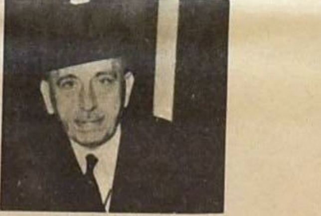
امي الدين الصالح