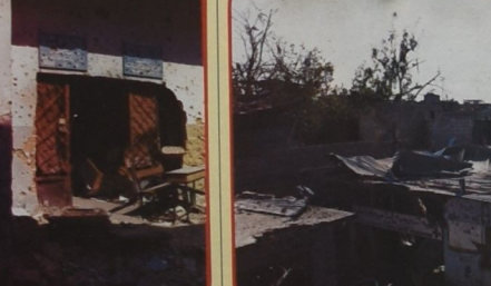
كان مقر ، الجمعية الترويجية الشعبية للاغالة،