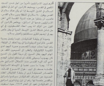
الفاتيكان يرفض الطابع اليهودي لمدينة القدس

وفي معرض تقبيمها لوثيقة الفاتيكان، تقول وكالة والبونات درس والإمريكة ان شعورا بالذنب تجاه اليهود، سيطر على اجتماعات اصدار هذه الوثيقة، والتركيز على تفهم ارتباط اليهود ارتباطا دينيا بارض اجدادهم، وهذا ما أثار العديد من لتساؤلات لدى الاوساط الديبلوساسية العربية في العاصمة الإيطالية، كما تقول الوكالة الامريكية، وفحوى هذه التساؤلات انه : اذا كان الفاتيكان قد ادرك خطورة الاوضاع التي سببتها الممارسات الاسرائيلية ضد الفلسطينيين، عندما اشار الى المعاملة الاسرائيلية تجاههم، وعدم قبوله بالطابع البهودي لمدينة القدس، نمتى يتجلى الشعور بالذنب تجاه الفلسطينيين، والاعتبراف، اعتبرافا كاملا، بحقوقهم في وطنهم، وهي الحقوق التي تتجاهلها واسرائيل و □□