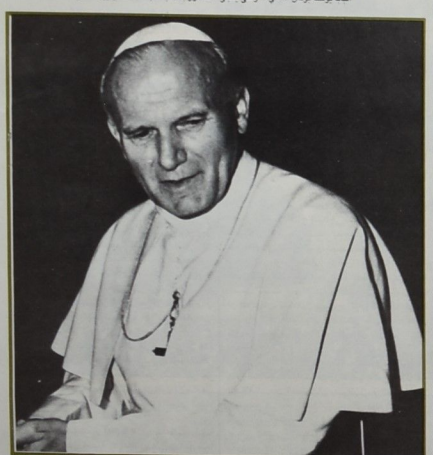
الفاتيكان لا يقبل بـ «قدس بهودية» ويتحدث عن «حل مِبتكر»!

الدابا بوهنا بولس الثاني .. ومثى يتجل الشعور بالذنب، تجاه الظبيطينين كشعب