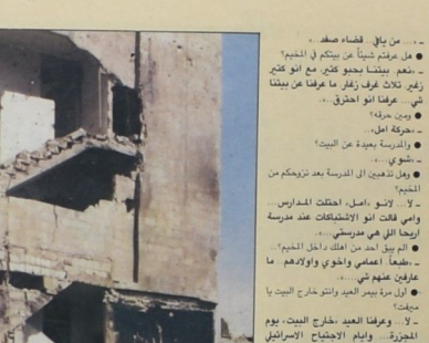
من شاتيلا الى ١٥٠ مليون عربي

لو نحد الكلمات التي نصف بها مشاعرنا، بعد أن وصلنا التحقيق المصور، من مراسلنا في بيروت، عن الاوضاع داخل مخيم صبرا وشاتيلا ووقعنا في حبرة؛ ماذا نختار من المئة صورة، وماذا نُحيل الى ادراج