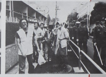
طوكمو _ فلسطين الثورة

بمناسبة مرور ثلاث سنوات على يدء الغزو الصهبوني للبنان، نظمت حركات التضامن مع الشعب القلسطيني في النابان مسيرة طافت شوارع طوكيو، وصولًا الى سفارة العدو الصهنوني في العاصمة العانانية وامام السفارة. اطلق المتظاهرون العابانيون شيعارات التابيد التاء النضال الشعب الغلسطيني. وممثله الشرعي والوجيد م ت في مطالعين بانسجاب المحتلين الإسرائيليين من كافة الاراضي العربية المحتلة، واقرار الحقوق الشروعة للشعب الفلسطيني. وفي مقدمتها حقه في اقامة دولته المستقلة على ارض