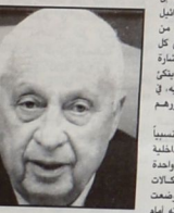
عبد القادر ياسين - كاتب وصحفي فلسطيني - القاهرة

الجزيرة - خالوس... إننا نعلن أننا لن نخجل من قتلنا علناً بل نفتخر بذلك. إننا نعلن أننا لن نخجل من قتلنا علناً بل نفتخر بذلك. إننا نعلن أننا لن نخجل من قتلنا علناً بل نفتخر بذلك.