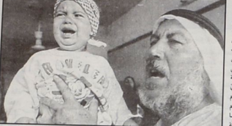
ملفلة الشهيد البيهوك ووالده في مسيرة الأوق

الديمقراطية؛ سؤايل المقاومة حتى در الاحتياط والاحتلال