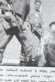
الجزيرة - رام الله

الجزيرة - رام الله... إننا نعلن أننا لن نخجل من قتلنا علناً بل نفتخر بذلك. إننا نعلن أننا لن نخجل من قتلنا علناً بل نفتخر بذلك. إننا نعلن أننا لن نخجل من قتلنا علناً بل نفتخر بذلك.