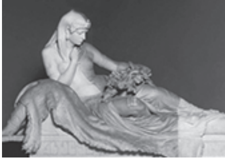
صورة تمثال لها في متحف الفن الحديث بروما.

كليوباترة اسم ساحر خلع عليه التاريخ وخلعت عليه الأساطير من ألوان الفتنة بهاء باهرًا تضاءلت إلى جانبه أسماء الزهرة وأفروديت وسميراميس وسائر آلهة الجمال، وهاتاسو ونيفرت وسائر الملكات، بل تضاءلت إلى جانبه أسماء الملوك، والشعراء، والكتاب؛ فهي ليست جميلة وكفى، وليست مليكة وكفى، وليست ساحرة الحديث وكفى، وليست ذكية وكفى، وليست أديبة وكفى، بل هي ذلك كله وهي أكثر من ذلك كله، هي الفتنة والسحر والذكاء والأدب والنشاط وقوة الإرادة في أسمى ما تصوره معاني هذه العبارات، وهي مع ذلك آخر البطالسة الذين حكموا مصر عصورًا طويلة كانت مصر فيها مهبط وحي الحكمة والشعر والجمال؛ لذلك لم يُفت مؤرخ ولا قصاص ولا شاعر أن يتحدث عن كليوباترة وأن يتغنى بحياتها، وأن يصور هذه الحياة على النحو الذي يجب أن تكون؛